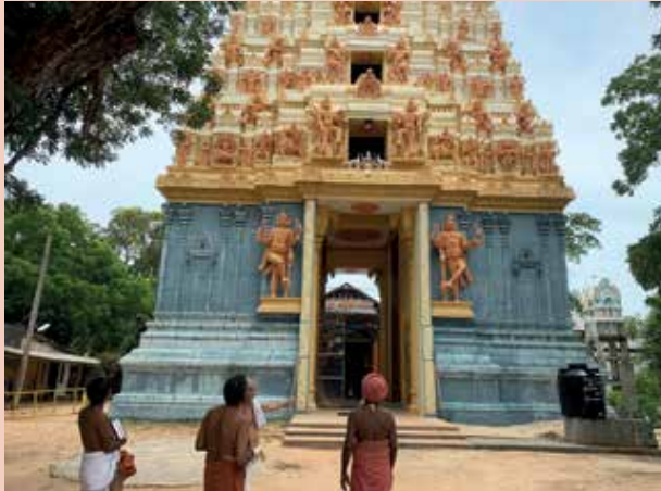
கீரிமலை அருள்மிகு நகுலேச்சரம் திருக்கோயில்