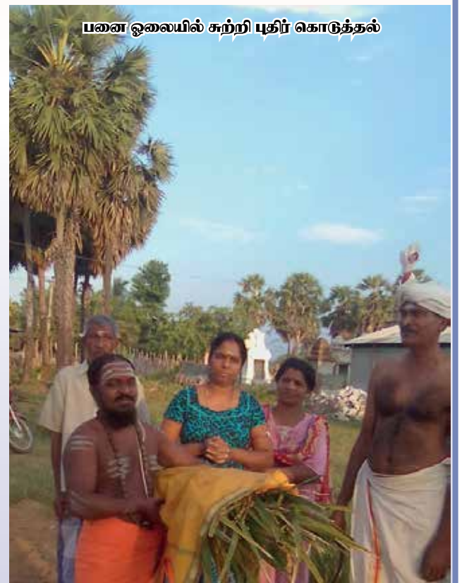
பனை ஓலையில் சுற்றி புதிர் கொடுத்தல்

இங்கு கழுவாய் தினங்களில் நந்தியெம்பெருமானுக்கு சிறப்பு பூசைகள் இடம்பெறுவதால், அந்நாட்களில் இங்கு பத்தர் கூட்டத்தை காணலாம். மற்றும் சிவனிரவு, ஒன்பா