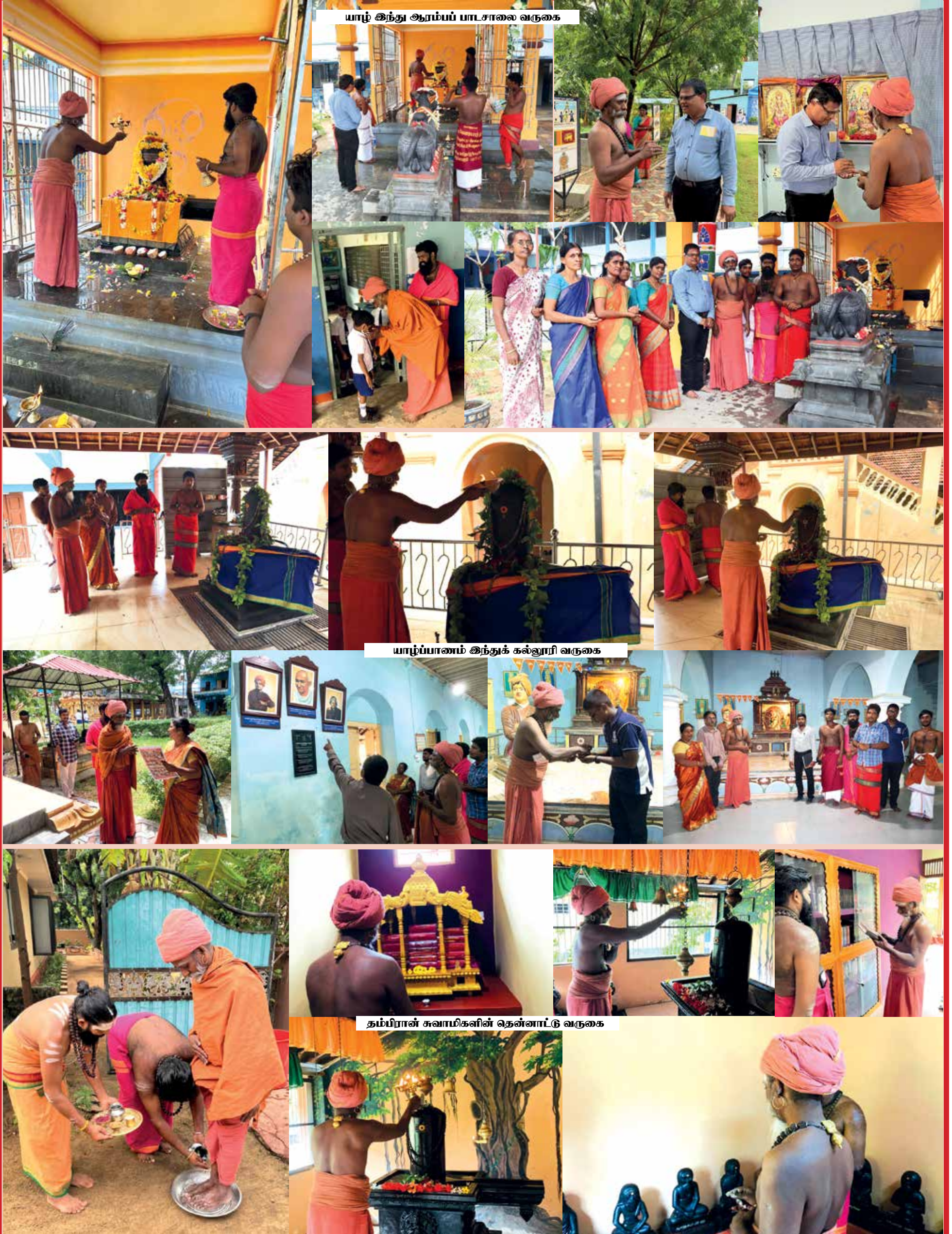
யாழ் இந்து ஆரம்பப் பாடசாலை வருகை