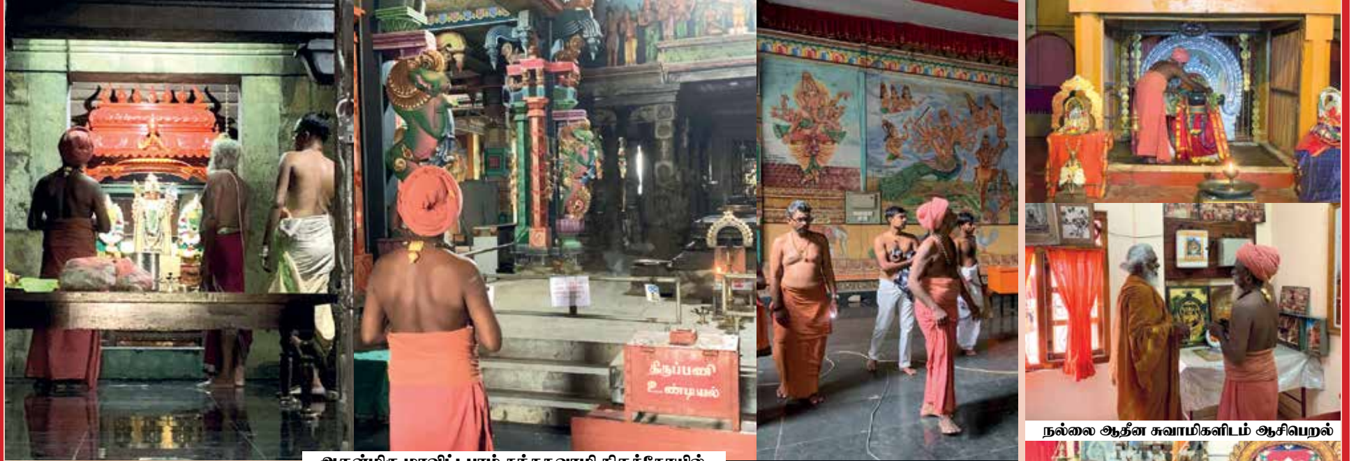
அருள்மிகு மாவிட்டபுரம் கந்தசுவாமி திருக்கோயில்