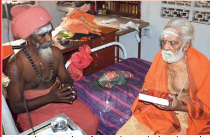
சிவாகமக்கலாநிதி ஸ்ரீசிவபுரீ நகுலேஸ்வர குருக்கள் அவர்களிடம்