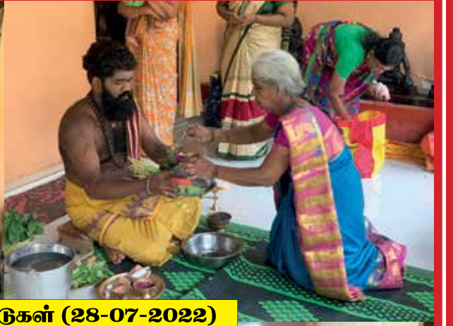
ஆடி மறைமதி தென்புலத்தார் வழிபாடுகள் (28-07-2022)