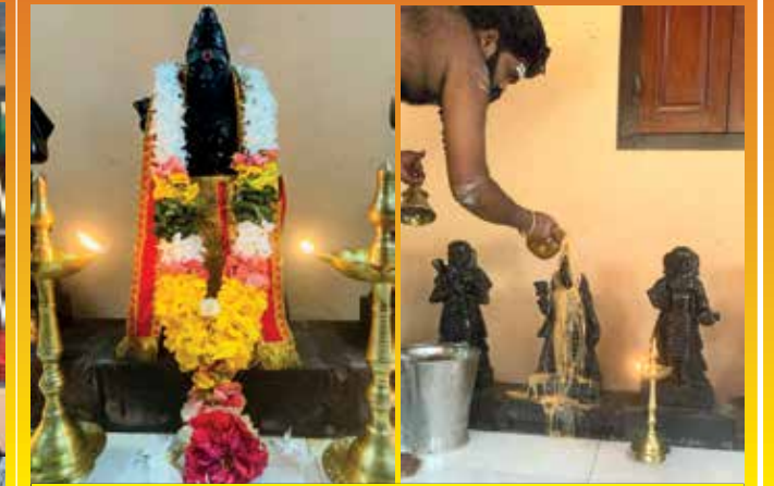
சுந்தரமூர்த்தி நாயனார் குருபூசை (05-08-2022)