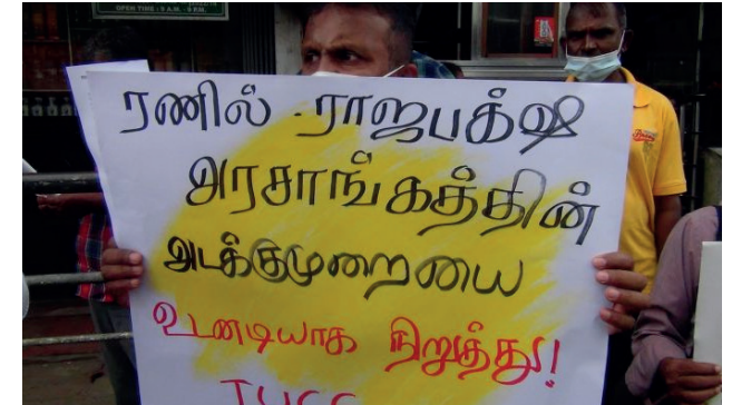
சுருட்டிக்கொள், பாராளுமன்றத்தை உடனே நிறுத்து, “புதிய மக்கள் ஆணைக்கு இடமளி” போன்ற பதாகைகளை ஏந்தியவண்ணம், கோஷங்களை எழுப்பியவாறு குறித்த போராட்டம் முன்னெடுக்கப்பட்டது. பாராளுமன்றத்தை களைத்து புதிய மக்கள் கருத்துக்கு இடமளிக்க வேண்டும். அத்தோடு, கைதுகளையும், அநீதியான ஆட்கடத்தல்களையும்

நிறுத்த வேண்டும் என போராட்டக்காரர்கள் வலியுறுத்தியதுடன், அவ்வாறு இல்லா விட்டால் போராட்டம் தொடரும் எனவும் குறைத்தனர். அத்துடன், கொழும்பு காலிமுக்கத்தி டல் போராட்டங்களத்தில் இடம்பெறும் போராட்டத்துக்கு தமது முழு ஆதரவையும், மலையக மக்கள் சார்பில் வெளிப்படுத்தினர்.