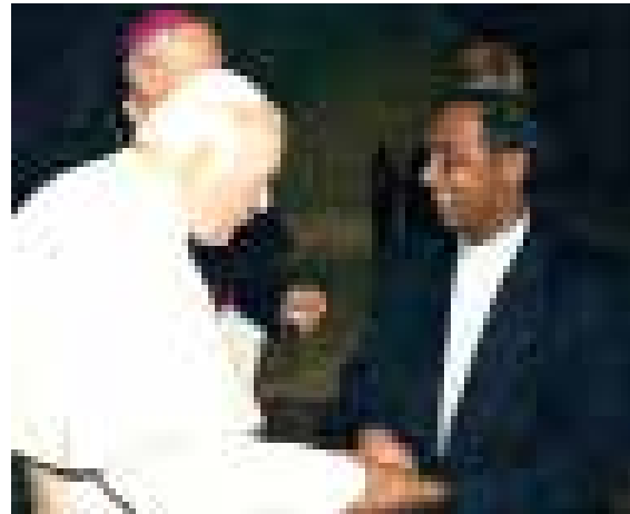
1997ஆம் ஆண்டு வத்திக்கானில் அப்போதைய திருத்தந்தை தற்போதைய புனிதர் 2ஆம் யோவான் போல் அவர்களைச் சந்தித்தபோது

நான் குருமட நிதியாளராக இருந்தமையால் நிதி பற் றிய அடுத்த நகர்வுகளையும் உணவுப் பொருள்களை எப்படி எல்லாம் பெறலாம் என்பது பற்றியும் கலந்துரை யாடவே அழைக்கிறார் என நினைத்துக் கொண்டு மிரு சுவிலுக்கு வந்தேன்.