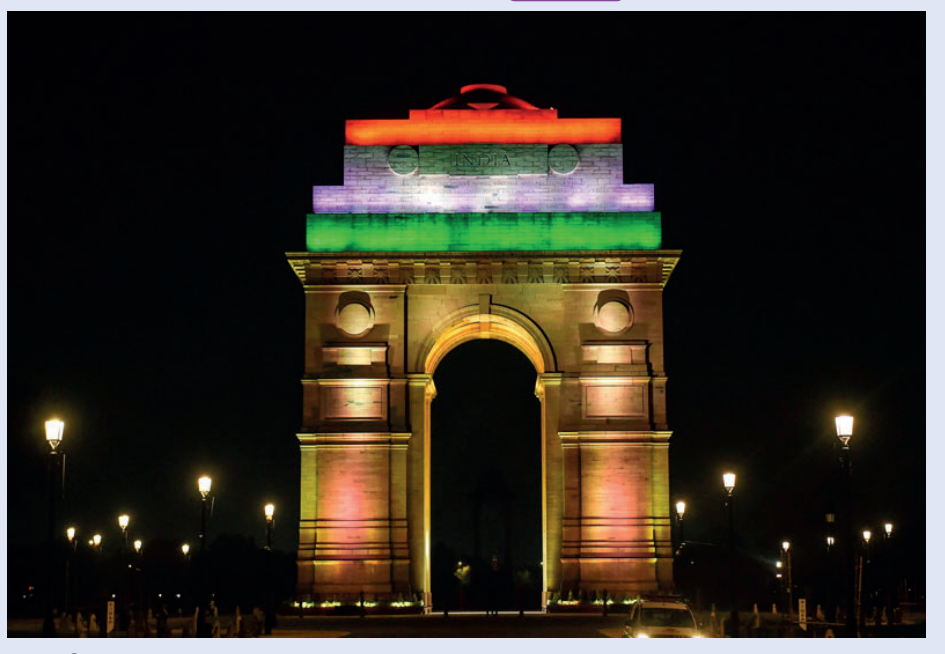
கைப்பெட்டிகள், கைப்பைகள், கெமராக்கள், பைனாகுலர்கள், குடைகள் உள்ளிட்டவை புதுடெல்லி, செங்கோட்டை வளாகத்தில் அனுமதிக்கப்படாது” என உயர் பொலிஸ் அதிகாரி ஒருவர் தெரிவித்துள்ளார். “அத்துடன், பட்டங்களையோ, பலூன்களையோ, சைனீஸ் லாந்தர்களையோ பறக்க விட்டால் தண்டிக்கப்படுவார்கள். வான்வழி தளங்கள், ஆளில்லா மற்றும் ஆள் உள்ள பறக்கும் பொருட்களில் இருந்து வரும் அச்சுறுத்தல்களை எதிர்கொள்ளும் வகையில், செங்கோட்டையில் ரேடார்கள் பயன்படுத்தப்படும் எனவும் தெரிவித்தார்.

இந்தியாவின் 75ஆவது சுதந்திர தினம், இன்று (15) கொண்டாடப்படுகிறது. புதுடெல்லி, செங்கோட்டையில் நடக்கிற கோலாகல விழாவில், பிரதமர் மோடி மூவரைக்கொடியை ஏற்றி வைத்து, நாட்டு மக்களுக்கு உரை ஆற்றுவார். இந்த விழாவில் கலந்துகொள்ளுமாறு ஏழாயிரம் பேர் அழைக்கப்பட்டுள்ளனர். புதுடெல்லி, செங்கோட்டையில் பல அடுக்கு பாதுகாப்பு போடப்பட்டுள்ளது. செங்கோட்டையை சுற்றிலும் 10 ஆயிரம் பொலீஸார் குவிக்கப்பட்டுள்ளனர். தேசிய கொடி ஏற்றும் வரையில், அதன் 5 கி.மீ பரப்பளவில் பட்டம் பறக்க தடை விதிக்கப்பட்டுள்ளது. டி.ஆர்.டி. ஓ.என்.என். இராணுவ ஆராய்ச்சி மற்றும் மேம்பாட்டு அமைப்பு மற்றும் பிற அமைப்புகளின் டி.ரோன் தர்ப்பு அமைப்புகள் நிறுவப்படுகின்றன. “செங்கோட்டையை சுற்றிலும் உயர் தெளிவுத்திறன் கொண்ட கெமராக்கள் பொருத்தி இருக்கிறோம். அவற்றில் பதிவாகி காட்சிகள், 24 மணி நேரமும் கண்காணிக்கப்படும். மதிய உணவு டப்பாக்கள், தண்ணீர் போத்தல்கள், ரிமோட்-கண்ட்ரோல் கார் சாவிக்கள், சிகரெட் லைட்டர்கள்,