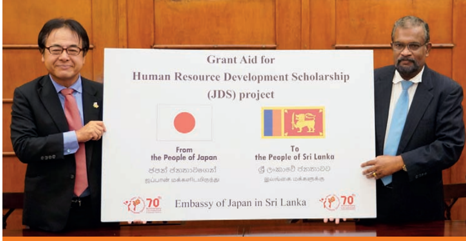
மனித வளங்கள் அபிவிருத்தி புலமைப்பரிசில் திட்டத்துக்கு