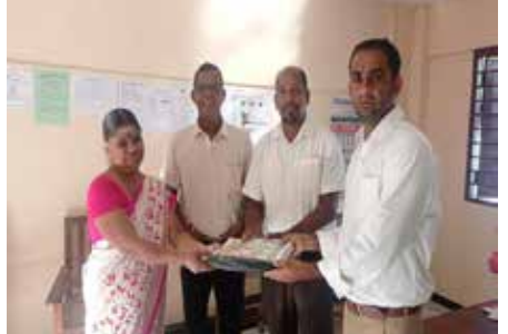
நூருல் /ஹதா உமர்

அம்பாறை மாவட்ட அரசு சார்பற்ற நிறுவனமான நிந்தவூர் பெஸ்ட் ஓப் யங் சமூக சேவைகள் அமைப்பு "மாணவர் மகிமை" வேலைத்திட்டத்தின் கீழ் பாடசாலை மாணவர்களுக்கான இலவச கற்றல் ஏடுகள் கையளிக்கும் நிகழ்வு இன்று இடம்பெற்றது