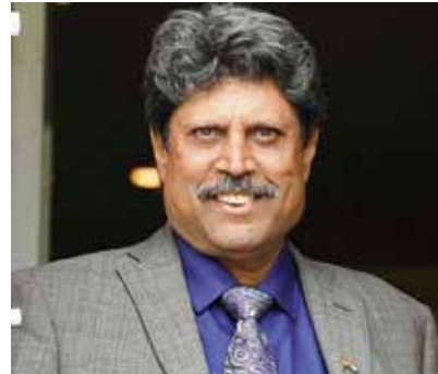
வருகிறது. அனைத்து நாடுகளும் கழக கிரிக்கெட் விளையாடினால் 4 வருடத்துக்கு ஒருமுறை மட்டுமே வரும் உலகக் கிண்ணத்தில் மட்டுமே விளையாட முடியும் - என்றார். (ஐ)

அனைவரும் இருபது - 20 கிரிக்கெட் தொடரிலே பங்கேற்பதில் குறியாக உள்ளனர். ஒருநாள், டெஸ்ட் கிரிக்கெட் போட்டிகள் அழியாமல் இருக்க ஐ.சி.சி.தான் அதற்கு நேரம் ஒதுக்க வேண்டும். கழக கிரிக்கெட், ஐ.பி.எல்., பிக் பாஷ் எல்லாம் சரி. தற்போது தென்னாபிரிக்க லீக், யூ. ஏ. ஈ. லீக்