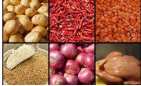
கொழும்பு, ஓக. 16

உருளைக்கிழங்கு, பருப்பு, சீனி, செத்தல் மிளகாய், வெங்காயம் போன்ற இறக்குமதி செய்யப்படும் அத்தியாவசிய உணவுப் பொருட்களின் மொத்த விலை நேற்றும்கு குறைவடைந்ததாக புறக்கோட்டை மொத்த விற்பனையாளர்கள் தெரிவித்தனர்.