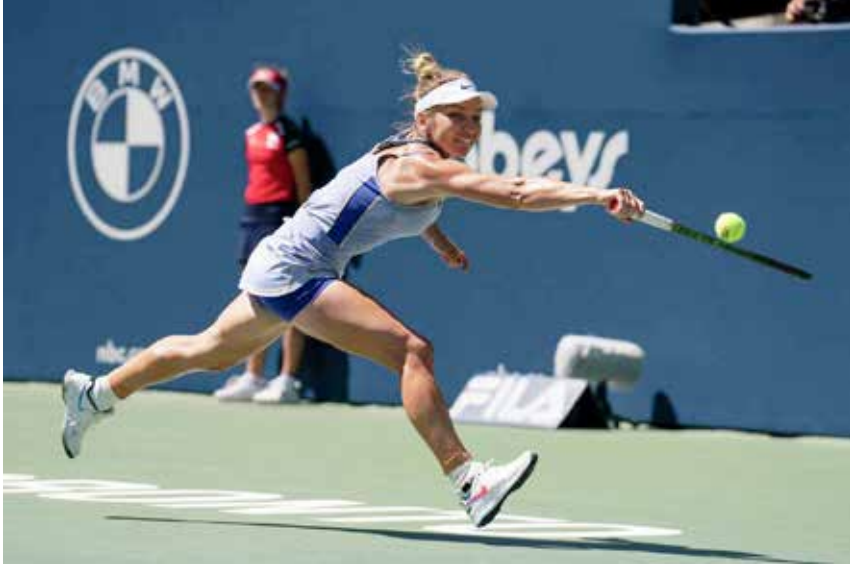
ரொறன்ரோ, ஓக. 16 கனடா ஒப்பன் ரென்னிஸ் தொடரில் பெண்கள் ஒற்றையர்