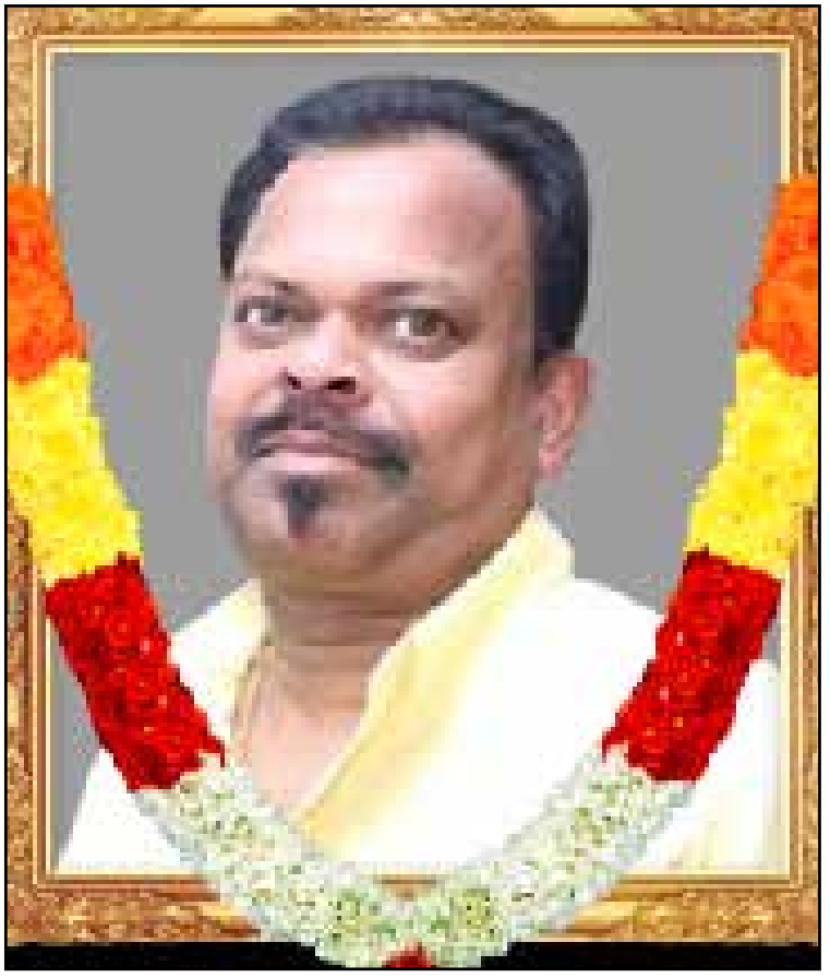
தகவல் : குடும்பத்தினர்.