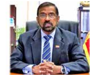
மே மாதம் தனது பதவியை இராஜிநாமா செய்திருந்தார் என்பது குறிப்பிடத்தக்கது. (ஐ)