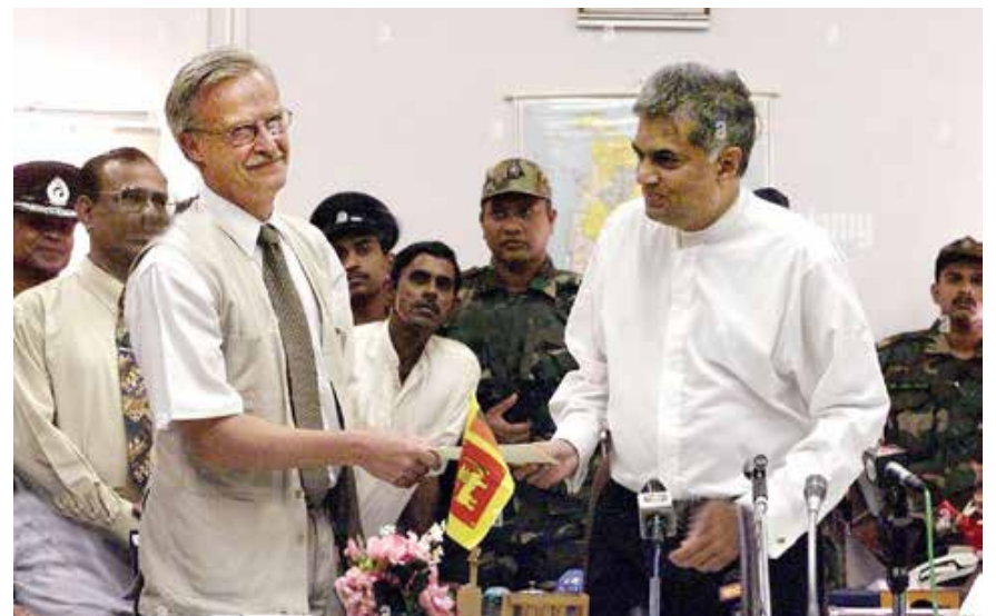
அப்போதைய பிரதமர் ரணில் தாம் ஒப்பமிட்ட யுத்த நிறுத்த ஆவணத்தை வவுனியா செயலகத்தில் வைத்து நோர்வேத் தூதுவரிடம் ஒப்படைக்கின்றார்.