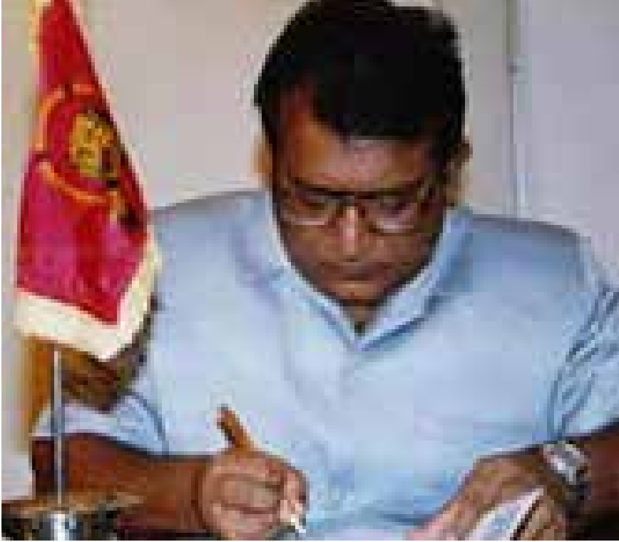
யுத்த நிறுத்த ஒப்பந்தத்தில் கைச்சாத்திடும் பிரபாகரன்.

'தமிழீழத் தாயகப் பிரச்சினை' என்ற கையேடு ஒன்று 'சிங்களக் குரல்' வெளியீடாக 2016 இல் பதிப்பிடப்பட்டது. அந்த பதிப்பில் அதனைத் தொகுப்பதற்கு தேவையான தகவல்களை 2002 -