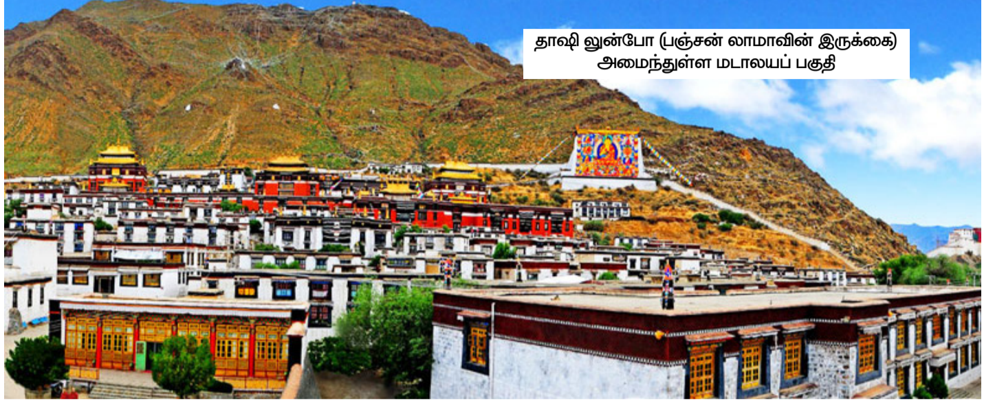
தாஷி லுன்போ (பஞ்சன் லாமாவின் இருக்கை) அமைந்துள்ள மடாலயப் பகுதி

வாக மிகவும் மதிக்கப்படும் லாமா மற்றும் கவர்ச்சியான நபர்களில் ஒருவரான சோய்கி கியால்ட்சென், திபெத்தில் கலாச்சாரப் புரட்சிக்குப் பிந்தைய காலத்தில் திபெத்தியர்களால் குறிப்பாக இந்த பாத்திரத்திற்காக போற்றப்பட்டு மதிக்கப்பட்டார். அவர் திபெத்திய பௌத்தத்தை மட்டுமல்ல, திபெத்திய மொழி மற்றும் கலாச்சாரத்தையும் திபெத்தியர்கள் கடந்த காலத்தின் கொடூரங்களை மறந்து பெருமைமிக்க சமூகமாக மாற உதவினார்.