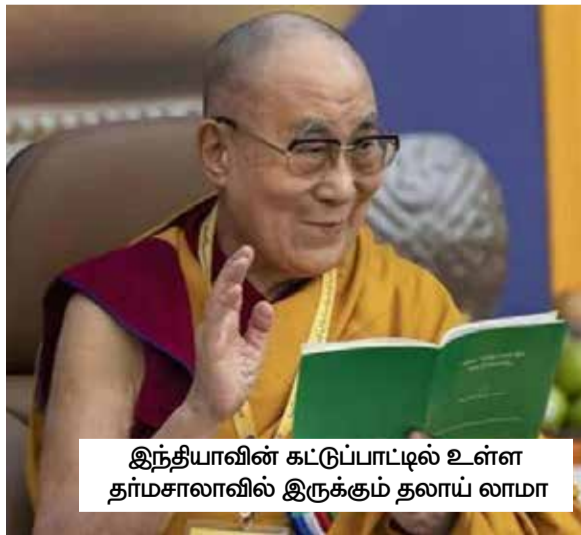
இந்தியாவின் கட்டுப்பாட்டில் உள்ள தர்மசாலாவில் இருக்கும் தலாய் லாமா

ஆயினும், ஜனாதிபதி ஜி ஜின்பிங் கடந்த ஆண்டு லாசாவிற்கு விஜயம் செய்தபோது அந்த அலங்கார இடம் கூட அவருக்கு வழங்கப்படவில்லை. அவர் அங்கு அழைக்கப்படாமை கூட உண்மையில் சீனத் தலைமை திபெத்திய பௌத்தத்தை மறந்து விட்டது - அது பற்றி ஒருபோதும் சிந்திக்கவில்லை - என்பதையே குறிக்கிறது.