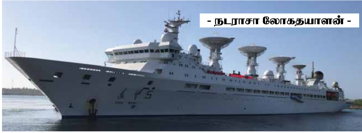
- நடராசா லோகதயாளன் -

இருப்பினும் ஜலை 14 அன்று வெளிவிவகார அமைச்சினால் உறுதியான அங்கீகாரம் அளிக்கப்பட்டது.