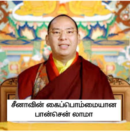
சீனாவின் கைப்பொம்மையான பான்சென் லாமா

திபெத்தியர்கள்தங்கள்நம்பிக்கையை விட்டு விலக மாட்டார்கள் என்று மக்கள் கருதுகிறார்கள், இது மிகவும் உண்மை. ஆனால் கியால்ட்சென் நோர்புவின் முன் முயற்சிகளுடன் நாம் இங்கு காணக்கூடியது என்னவென்றால், இந்த உண்மையை அறிந்த சீனா திபெத்திய பௌத்தத்தின் கதையை திபெத்தியர்களுக்கு மட்டும் மாற்ற விரும்புகிறது. திபெத்தை சீனா ஆக்கிரமித்ததில் இருந்து திபெத்திய பௌத்தர்கள் மட்டுமல்ல, திபெத்திய பௌத்தத்தில் ஈடுபாடு கொண்டு பின்பற்றும் சீனப் பெருநில மக்களும் சீனாவின்