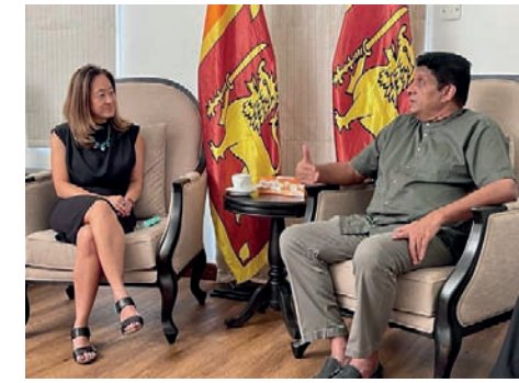
வாழ்க்கைக்கு எதிரான அடக்குமுறையை