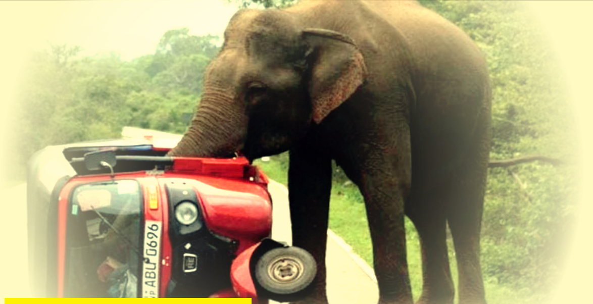
யானைகள் எதிர் மனிதர்கள்