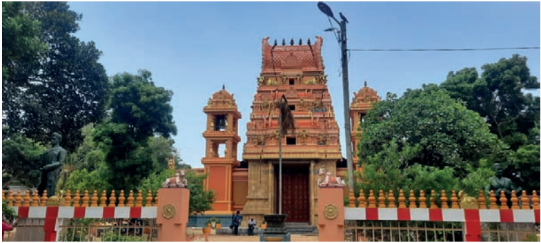
பரமேஸ்வரா கல்லூரி நிகழ்வு மற்றும் கலைஞர்கள் இயக்குனர் சபையின் ஏற்பாட்டில், வேதாகம பாடசாலை ஆரம்ப இடம்பெறவுள்ளன.

யாழ்ப்ப. பல்கலைக்கழக அருள்மிகு ஸ்ரீ பார்வதி சமேத பரமேஸ்வரன் கோவில் மண்டலாபிஷேக பூர்த்தி விழா, இன்று செவ்வாய்க்கிழமை (23) காலை 6 மணியிலிருந்து சங்காபிஷேகத்துடன் இடம்பெறவுள்ளது. இதன்போது கோவில் வளாகத்தில் புதிதாக நிர்மாணிக்கப்பட்ட ஸ்ரீலக்ஷ் ஆறுமுக நாவலர் மற்றும் சேர். பொன்.இராமநாதன் அவர்களது திருவுருவச் சிலைகள் திறந்து வைக்கப்பட்டவுள்ளன.