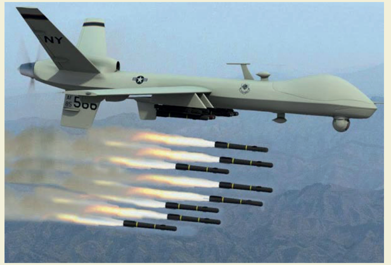
ட்ரோனை அமெரிக்காவிடம் இருந்து வாங்கும் முயற்சியை கடற்படை மேற்கொண்டது. இராணுவம், விமானம் மற்றும் கடற்படைக்கு சேர்த்து மொத்தம் 30 ட்ரோன்களை, 23 ஆயிரத்து 700 கோடி ரூபாய்க்கு வாங்க திட்டமிடப்பட்டது.

அ மெரிக்காவிடம் இருந்து இந்திய இராணுவத்துக்கு 30, 'எம்க்யூ9பி பிரிடேட்ர' ட்ரோன்கள் வாங்குவது தொடர்பான பேச்சுவார்த்தையில் முன்னேற்றம் ஏற்பட்டுள்ளதாக தகவல் வெளியாகியுள்ளது. இந்தியா - சீனா இடையே லடாக் எல்லையில் மோதல் ஏற்பட்டதை தொடர்ந்து, எல்லைப் பகுதி கண்காணிப்பில் இந்திய இராணுவம் தீவிரம் காட்டி வருகிறது. 'ட்ரோன்' எனப்படும் ஆளில்லா சிறிய ரக விமானங்கள் வாயிலாக, எல்லை கண்காணிக்கப்பட்டு வருகின்றன. இந்நிலையில், கண்காணிப்பு மட்டுமின்றி, தாக்குதலும் நடத்தும் திறன் உடைய, 'எம்க்யூ9பி பிரிடேட்ர' என்ற