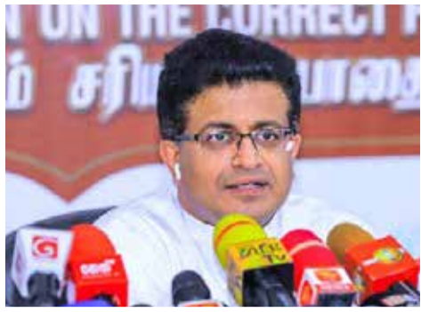
வன்முறைகள் ஏற்பட காரணம், அவரின் பின்னணியில் இருந்தது யார் என்பதை கண்டறிய உடனடியாக ஜனாதிபதி ஆணைக்குழுவை நியமிக்குமாறு நாங்கள் ஜனாதிபதியிடம் கோரிக்கை விடுக்கின்றோம்.

கடந்த மே 9 ஆம் திகதி முதல் ஜூலை 12 ஆம் திகதி வரை நாட்டுக்குள் நடந்த வன்முறைகள் தொடர்பான விசாரணைகளை நடத்துவதற்காக உடனடியாக ஜனாதிபதி ஆணைக்குழுவை நியமிக்குமாறு நாடாளுமன்ற உறுப்பினர் உதய கம்மன்பில, ஜனாதிபதி ரணில் விக்கிரமசிங்கவிடம் கோரிக்கை விடுத்துள்ளார். கொழும்பில் நேற்று இடம்பெற்ற ஊடக சந்திப்பின் போதே அவர் இவ்வாறு தெரிவித்துள்ளார். ஜனாதிபதி ஆணைக்குழு நியமிக்கப்படுமாயின் வன்முறைகளுக்கு பொறுப்பானவர்கள் தொடர்பில் சாட்சியங்களுடன் தகவல்களை வழங்க தயார்.