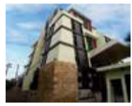
WATER BOARD BUILDING - Jaffna