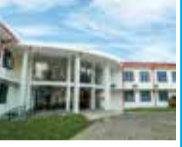
ROAD DEVELOPMENT DEPARTMENT OFFICE Jaffna