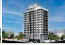
NO. 35, RAMAKRISHNA ROAD - COLOMBO 06