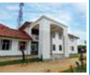
COURT COMPLEX - Chavakachcheri

LINK LINK ENGINEERING A LEGENDARY CONSTRUCTION TYCOON SINCE 1981