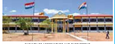
FACULTY OF AGRICULTURE AND ENGINEERING University of Jaffna in Kilinochchi