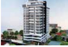
NO. 15A, LAYARDS ROAD - COLOMBO 04