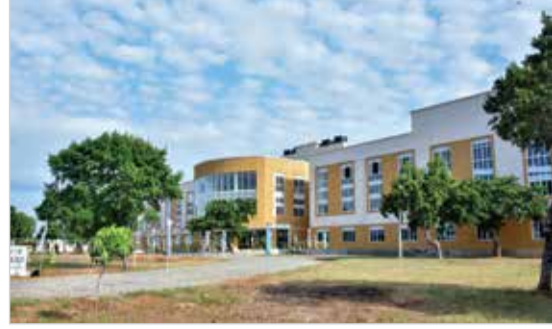
FACULTY OF ENGINEERING AND BIO SYSTEM TECHNOLOGY at Ariyiyal Nagar, Kilinochchi.