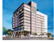
FACULTY OF MEDICINE BUILDING University of Jaffna

Link Engineering, a member of Blue Ocean Group of Companies, is one of the first few construction companies in Sri Lanka with experience spanning over four decades. They have been recognized with many awards for their construction excellence over the years. They continue to hold their unbeaten records and determine to achieve more for the future.