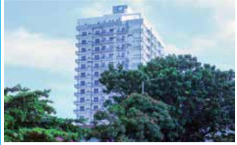
NO. 45, KING ALFRED PALACE - COLOMBO 03