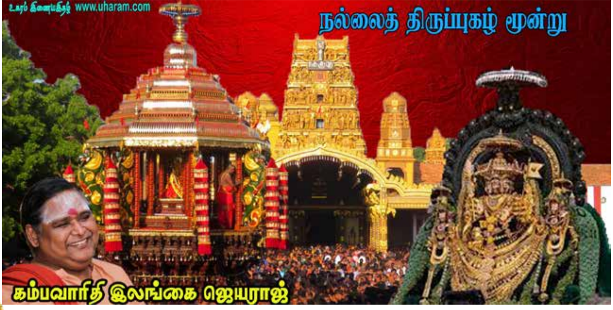
கம்பவார்த் இலங்கை ஜெயராஜ்

முந்து தமிழ் அதனால் யாரும் முருகனவன் தனையே துற்றி சொல்லியும் அருளே செய்யும் - பெருமானே.