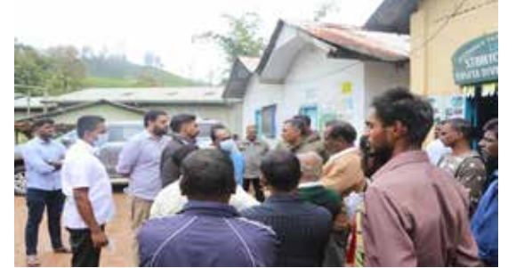
தலவாக்கலை பி.கேதீஸ் கொட்டகலை ரொசிட்டா தோட்டத்தில் தொழிலாளர்களுக்கும், தோட்ட நிர்வாகத்திற்கும் இடையில் ஏற்பட்ட முறுகல் நிலைமை சமரச பேச்சுவார்த்தையின் மூலம் தீர்த்து வைக்கப்பட்டுள்ளது.