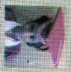
சென்ட் ஆல்பிரைட் கிளாஸ் 179 புள்ளி