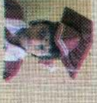
சென்ட் சிமோன் கிளாஸ் 131 புள்ளி