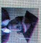
சென்ட் லூசியஸ் கிளாஸ் 140 புள்ளி