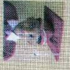
சென்ட் கிரிஸ்டின் கிளாஸ் 174 புள்ளி