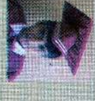
சென்ட் லூசியஸ் கிளாஸ் 134 புள்ளி