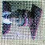
சென்ட் ஸுலிவான் கிளாஸ் 175 புள்ளி