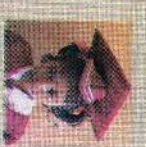
சென்ட் ஸுலிவான் கிளாஸ் 165 புள்ளி