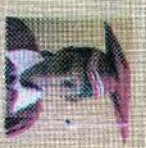
சென்ட் ஸுலிவான் கிளாஸ் 167 புள்ளி