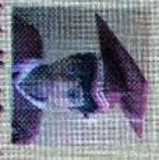
சென்ட் ஆர்ச்சிஸ் கிளாஸ் 142 புள்ளி