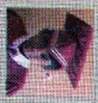
சென்ட் சிமோன் கிளாஸ் 142 புள்ளி