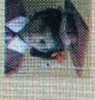
சென்ட் லூசியஸ் கிளாஸ் 132 புள்ளி