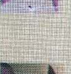
சென்ட் லூசியஸ் கிளாஸ் 139 புள்ளி