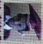
சென்ட் லாபியர்ஸ் கிளாஸ் 154 புள்ளி