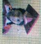
சென்ட் லூசியஸ் கிளாஸ் 133 புள்ளி