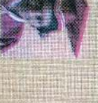
சென்ட் லூசியஸ் கிளாஸ் 137 புள்ளி