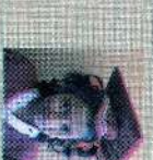
சென்ட் கிரிஸ்டின் கிளாஸ் 140 புள்ளி