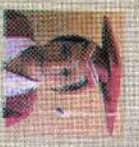
சென்ட் லூசியஸ் கிளாஸ் 131 புள்ளி