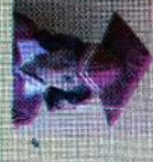
சென்ட் லூசியஸ் கிளாஸ் 135 புள்ளி