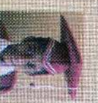
சென்ட் லூசியஸ் கிளாஸ் 137 புள்ளி