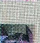
சென்ட் லூசியஸ் கிளாஸ் 138 புள்ளி