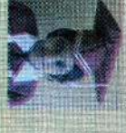
சென்ட் லூசியஸ் கிளாஸ் 134 புள்ளி