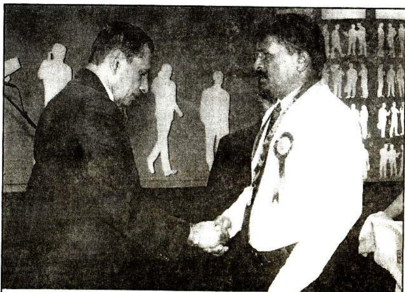
சிறந்த வாங்கிச் சேவையாளருக்கான விருது வழங்கப்பட்ட போது

செய்வோம்" என்றும், ஒரு கெட்ட பழக்கமுமே இல்லாத கணைசுவக்கு ஏன் இந்த நோய் வந்தது என்றும் சொல்லிச் சொல்லி மாய்ந்து போனார்கள்.