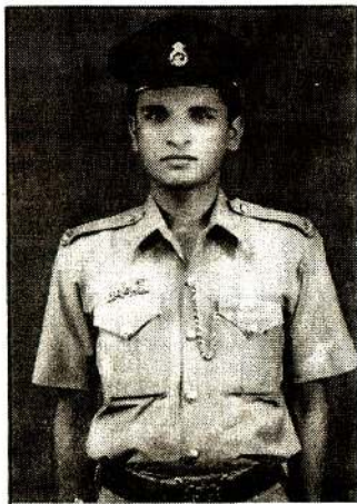
பொலிஸில் உள்ள போது