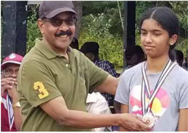
தொடர்ந்து காலை உணவு வழங்கப்பட்டது. அதன்பின் சிறுவர்களுக்கான விளையாட்டுப் போட்டிகள் நடைபெற்று மதிய உணவு வழங்கப்பட்டது.