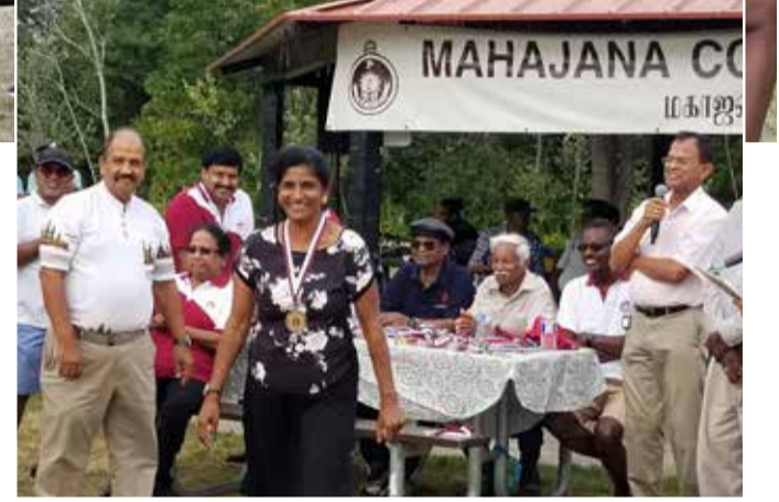
யளவில் நடைபெற்ற பரிசளிப்பு நிகழ்வில் சிறப்பு விருந்தினர்களால் பரிசுகள் வழங்கப்பட்டன. மாலை 6:00 மணியளவில் நிகழ்வு நிறைவுபெற்றது.

கனடாவில் இயங்கிவரும் மகாஜனாக்கல்லூரி பழைய மாணவர் சங்க அங்கத்தவர்களும், கல்லூரி நலன்விரும்பிகளும் சென்ற ஞாயிற்றுக்கிழமை ரொறன்ரோவின் மக்கோவான் - ஸ்ரீல் சந்திக்கு அருகே உள்ள பூங்காவில் ஒன்றுகூடக் கொண்டாடினார்கள். கோவிட் - 19 காரணமாக இரண்டு வருடங்கள் தள்ளிப் போடப்பட்ட இந்த நிகழ்வு மிகவும் சிறப்பாக இம்முறை நடைபெற்றது.