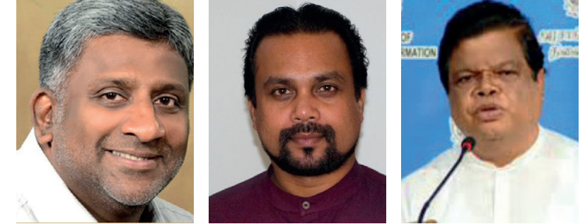
விளைவிக்கப்பட்டன. குறித்த எம்.பிக்கள் தமது வீடுகளுக்கு தீ வைக்கப்பட்டதாக மனித உரிமைகள் ஆணைக்குழுவில் முறைப்பாடு செய்தமைக்கு அமையவே தொடர்ச்சி P2

அமைச்சர்களான பந்துல குணவர்தன, பிரசன்ன ரணதுங்க மற்றும் பாராளுமன்ற உறுப்பினர் விமல் வீரவன்ச ஆகியோர் மனித உரிமைகள் ஆணைக்குழுவில் இன்று (29) ஆஜராகுமாறு அழைப்பு விடுக்கப்பட்டுள்ளது. கடந்த மே மாதம் 9ஆம் திகதி மற்றும் அதற்குப் பின்னரான காலப்பகுதியில் இடம்பெற்ற வன்முறைச் சம்பவங்களின் போது, எம்.பிக்களின் வீடுகள் எரிக்கப்பட்டதுடன், வீடுகளுக்கு தீ வைக்கப்பட்டதாக தொடர்ச்சி P2