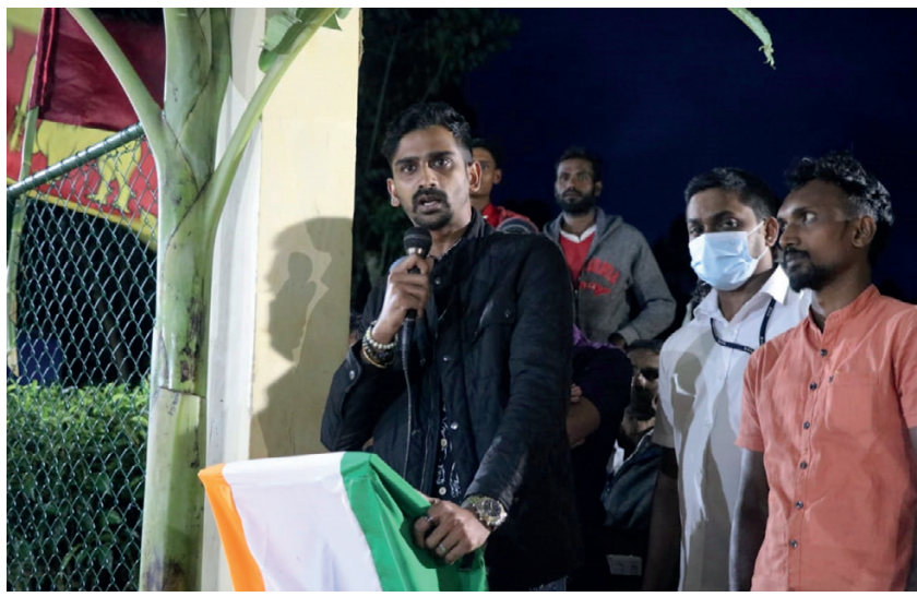
நாட்டில் விரைவில் உள்ளூராட்சி மன்றங்களுக்கான தேர்தல் நடைபெறும் என தெரியவந்துள்ளது. அந்த தேர்தலில் பிரதேச மக்களை உள்ளடக்கிய தோட்டப்பகுதி இளைஞர், யுவதிகளை போட்டியிட

■ ஜீவன் எம்.பி. உறுத் எஸ்கேசைன் நாட்டில் கூடிய விரைவில் உள்ளூராட்சி மன்றங்களுக்கான தேர்தல் இடம்பெற போகின்றது என தெரிவித்த இலங்கை தொழிலாளர் காங்கிரஸின் பொது செயலாளரும், நுவரெலியா மாவட்ட பாராளுமன்ற உறுப்பினருமான ஜீவன் தொண்டமான், இந்த தேர்தலில் இலங்கை தொழிலாளர் காங்கிரஸ் சார்பாக அந்தந்த தோட்டப்பகுதியில் உள்ள இளைஞர், யுவதிகளுக்கு போட்டியிட வாய்ப்பளிக்க போவதாகவும் தெரிவித்தார். மஸ்கெலியா சாமிமலை மாக்கலை தோட்டத்தில் இரவு பகல் கரப்பந்தாட்ட விளையாட்டு மைதானத்தை திறந்து வைத்து உரையாற்றும் போதே, மேற்கண்டவாறு தெரிவித்தார். தொடர்ந்து தெரிவித்த அவர்,