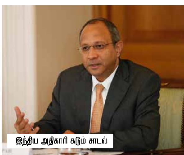
இந்திய அதிகாரி கடும் சாட்ல்