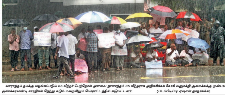
வாராந்தம் தமக்கு வழங்கப்படும் 05 லிபர் பெற்றோல் அளவை நாளைந்தம் 05 லிபராக அதிகரிக்க கோரி வலுசெறி அமைச்சுக்கு முன்பாக முச்சக்கரவண்டி சாரதிகள் நேற்று கரும் மழையிலும் போராட்டத்தில் ஈடுபட்டனர்.