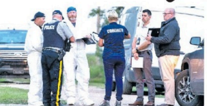
கனடாவின் மத்திய எல்லை சிவான் மாகாணத்தில் நேற்று 13 இலட்சத்தில் கத்திக்குத்து சம்பவங்கள்

பதிவாகியுள்ளன. இந்தச் சம்பவங்களில் 10 பேர் உயிரிழந்துள்ளனர். 15 பேர் படுகாயமடைந்தனர். இதுதொடர்பாக விசாரணை மேற்கொண்ட பொலிஸார் சந்தேகத்திற்குரிய 2 பேரை ஜேடி வசூலித்தனர். கனடாவில் அடுத்தடுத்து நிகழ்ந்த கத்திக்குத்து சம்பவங்கள் அந்தநாட்டில் பரபரப்பை ஏற்படுத்தியுள்ளது. இதனிடையே எல்லைக்கிடையில் நடந்த தாக்குதல்கள் கொடுமைகளை ஏற்று இது இதுபற்றி உடையுள்ளன என்றும் அந்தநாட்டு பிரதமர் ஜஸ்டின் டூரோ தெரிவித்துள்ளார்.