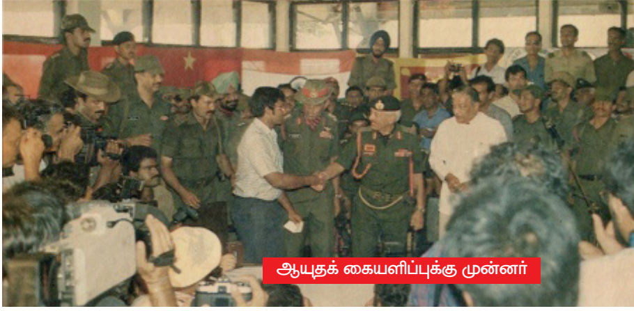
ஆயுதக் கையளிப்புக்கு முன்னர்

பலாலி விமானப் படைத்தளத்தில் ஒழுங்கு செய்யப்பட்டிருந்த இந்த வைபவத்தை பார்வையிட, செய்திகள் சேகரிக்க நூற்றுக்கு மேற்பட்ட செய்தி நிருபர்கள், ஊடகவியலாளர்கள் பலநாடுகளில் இருந்தும் கூடியிருந்தனர். அவர்களுக்கு உள்ளே செய்திகளுக்குள் செய்திகள் சேகரிக்க உளவியல் துறை விற்பன்னர்களும் பின்னிப் பிணைந்திருந்தனர்.