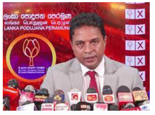
நவீனர்களின் நிலைப்பாடும் ஆகும்.

அவர்கள் ஆர்ப்பாட்டங்களின் போது பதவிலிலகியமைதவறு என்பதே என்னுடைய தனிப்பட்ட கருத்தும், கட்சியில் பெரும்பாலானவர்களின் நிலைப்பாடும் ஆகும்.