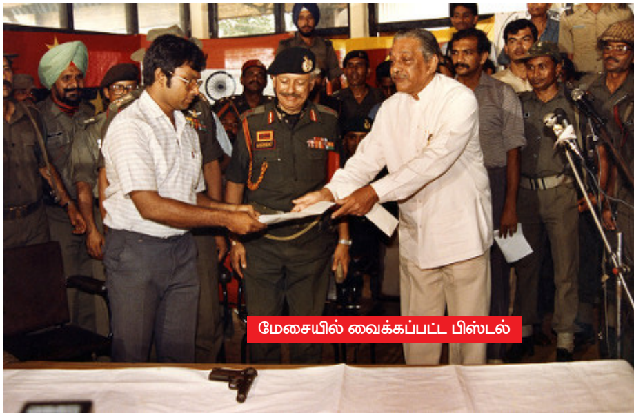
மேசையில் வைக்கப்பட்ட பிஸ்டல்

இவை யாவும் இந்தியா விடுதலைப் புலிகளுக்கு முன்னர் தந்திருந்த ஆயுதங்கள்.