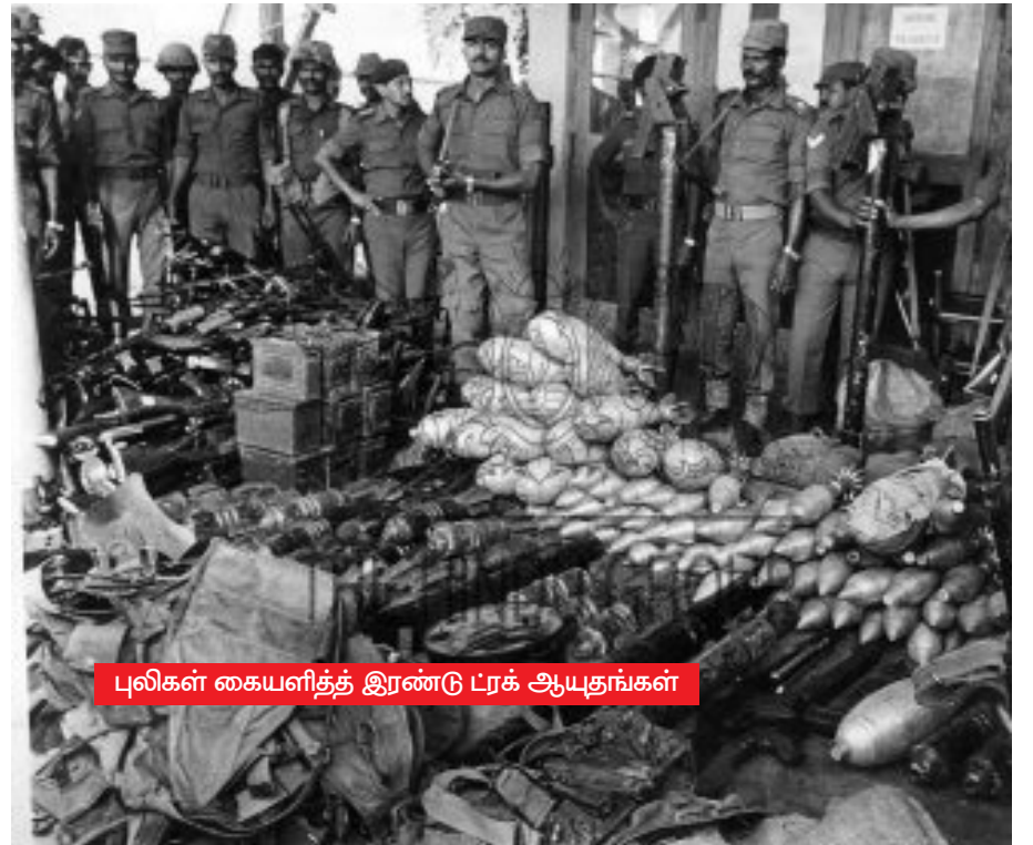
புலிகள் கையளித்த இரண்டு ட்ரக் ஆயுதங்கள்