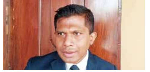
பயன்படுத்துகின்றனர் எனவும் அவர் குறிப்பிட்டுள்ளார்.

இணைய ஊடகம் ஒன்றுக்கு வழங்கிய செவ்வியில் அவர் இதனைக் குறிப்பிட்டுள்ளார். நாடளாவிய ரீதியில் இடம்பெறும் பல குற்றச்செயல்களில் பாதாள உலகக் குழு உறுப்பினர்கள் உரிய துப்பாக்கிகளைப்