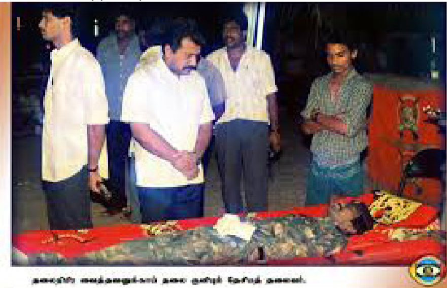
தனது தந்தை அவர்களுடன் தலை குனிந்து பேசும் அவர்கள்.

இயலாத தன்மைகளுக்கு எதிராகத் தூய்மை போடப்பயன்படுத்தப்பட்டன. இப்படியான தூண்டுதல்களுக்குத்தானா இவை நடத்தப்படுகின்றன என்ற சந்தேகங்களும் இந்தியப் பகுதிகளுக்கு வலுவாக இருந்தன.