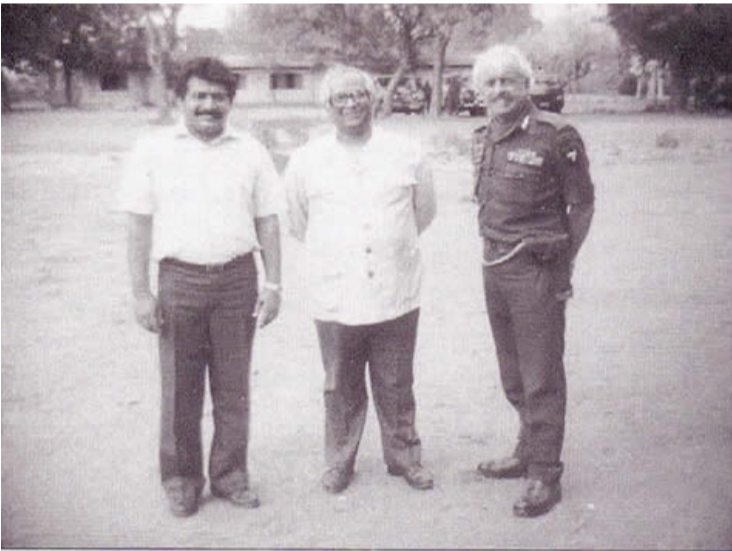
Mr. J.N. Dixit with the LTTE Supremo Pirabakaran and Maj. Gen. Harkirat Singh, GOC IPKF after the conference on 26 September 1987.

ளிக்க போவதில்லை, ஆகவே, அவர்களை உள்ளடக்கி இடைக்கால நிர்வாகத்தை அமைக்கத் தான் தயார் இல்லை என்ற திமிரைக் காட்டினார்.