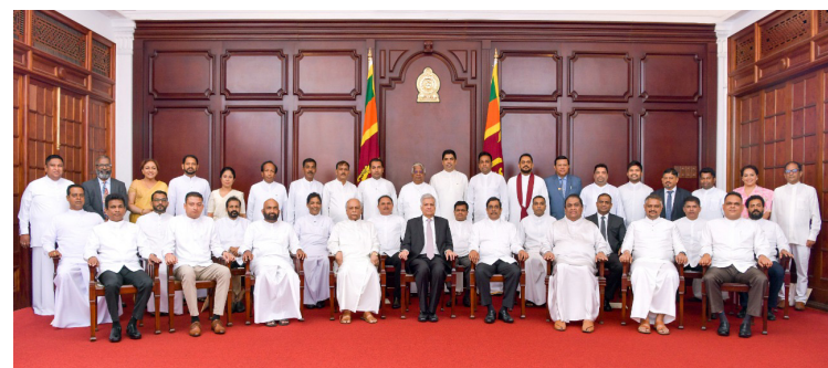
பொறுப்பாகும். அதற்காக இராஜாங்க அமைச்சர்கள் என்ற வகையில் அரசின் பொறுப்புக் களை ஏற்று

நாட்டின் பொருளாதார ஸ்திரத்தன்மையை நிலைநாட்டுவது தற்போது மிக முக்கியப்