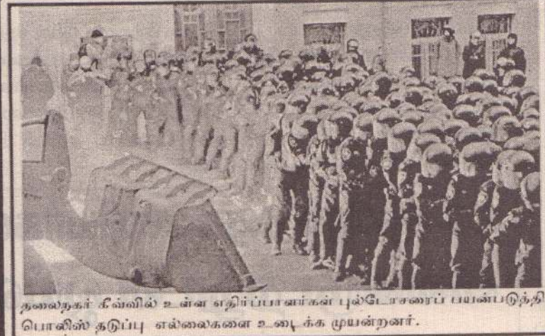
தலைநகர் கீவ்வில் உள்ள எதிர்ப்பாளர்கள் புல்டோசரைப் பயன்படுத்தி பொலிஸ் தடுப்பு எல்லைகளை உடைக்க முயன்றனர்.

குற்றச்சாட்டை சுமத்தியது மற்றும் அவரை கைது செய்ய பிடி ஆணை பிறப்பித்தது.