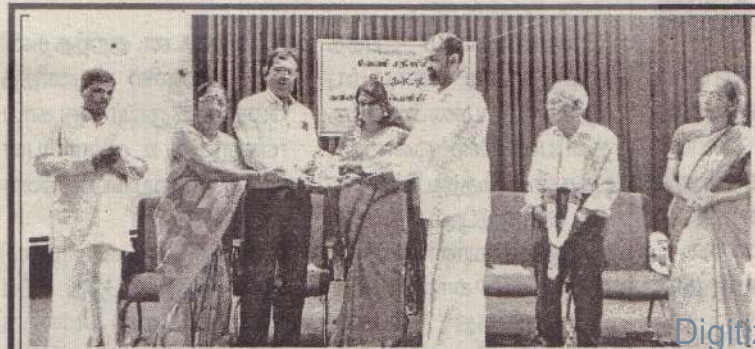
புலம்பெயர்ந்து தந்து வரும் படைப்பாளிகள் போது லண்டனில் வசி வேணி சதீஸின் "ஆட்

(சாவகச்சேரி) சாவகச்சேரி சந்தை வளாகத்தில் நிறுத்தி வைக்கப்பட்டிருந்த துவிச்சக்கரவண்டி ஒன்று நேற்று முன்தினம் சனிக்கிழமை திருடப்பட்டிருப்பதாக சாவகச்சேரி பொலிஸ் நிலையத்தில் முறைப்பாடு வழங்கப்பட்டுள்ளது. மீசாலை மேற்கைச் சேர்ந்த 17 வயதான மாணவன் ஒருவர் சந்தை வளாகத்தில் துவிச்சக்கரவண்டியை நிறுத்தி விட்டு மேலதிக வகுப்பிற்காக பேருந்தில் யாழ்ப்பாணம் சென்ற போதே குறித்த திருட்டு இடம் பெற்றிருப்பதாகத் தெரிவிக்கப்படுகிறது. (4-30)