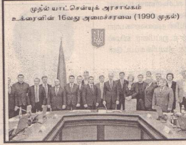
முதல் யாட்சென்யுக் அரசாங்கம் உக்கரைனின் 16வது அமைச்சரவை (1990 முதல்)

2014 இல் திட்டமிடப்பட்டது. யானுகோவிச் பெப்ரவரி 28 அன்று ரஷ்யாவின் ரோஸ்டோவ்-நா-டோனுவில் மீண்டும் தோன்றினார். மேலும் அவர் ரஷ்ய மொழியில் ஒரு எதிர்மறையான உரையை நிகழ்த்தினார். அவர் தான் தான் இன்னும் உக்கரைனின் சரியான ஜனாதிபதி என்று வலியுறுத்தினார்.