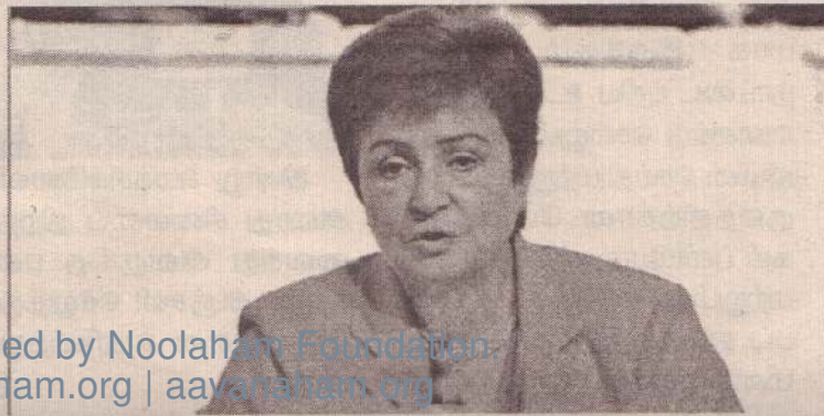
Digitized by Noolaham Foundation. noolaham.org | aayanaham.org

இலங்கை அரசாங்கமும் சர்வதேச நாணய நிதியமும் 2.9