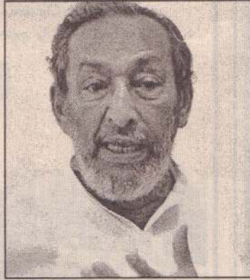
ங்க இணைக்க எதிர்பார்த்துள்ளார். (4)

சுயாதீன கட்சிகளினால் எந்தா பிக்கப்படவுள்ள புதிய அரசியல் கூட்டணியில் அரசாங்கத்தில் இருந்து பிரிந்து சுயாதீனமாக செயற்படுவார். இளைஞர், பெண்கள் உட்பட பலரை கூட்டணியின் கொள்கைகளுக்கிணை