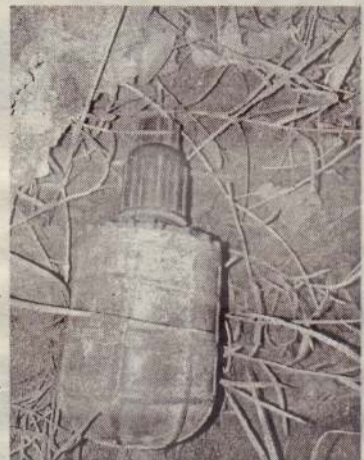
அதனை அடுத்து குறித்த நபர் 14 நாட்கள் தடுப்பு காவலில் வைக்கப்பட்டதுடன் மேலதிக விசாரணைகளை தருமபுர பொலிஸார் மேற்கொண்டு வருகின்றனர். (4-316)

(தருமபுரம்) தருமபுரம் உழவனூர் பகுதியில் கசிப்பு உற்பத்தியில் ஈடுபட்ட ஒருவர் கைது செய்யப்பட்டார். தருமபுர பொலிஸாருக்கு கிடைக்கப் பெற்ற தகவலுக்கு அமைய இக் கைது நடவடிக்கை இடம் பெற்றுள்ளது. அவரிடம் மேற்கொண்ட சோதனையின் போது அவரது உடைமையில் மறைத்து வைக்கப்பட்டிருந்த நிலையில் கைக்குண்டு மீட்கப்பட்டது. குறித்த கைக்குண்டை கைவிடப்பட்ட பகுதி ஒன்றில் இருந்து மீட்டதாகவும் அதனை பொலிஸாரிடம் ஒப்படைப்பதற்காக வைத்திருந்ததாகவும் சந்தேகநபர் தெரிவித்தார். (4-316)