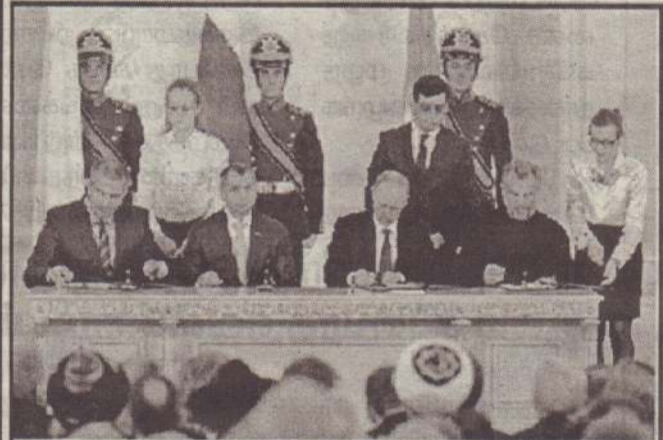
கிரிமியா மற்றும் செவாஸ்டோபோல் குடியரசை ரஷ்யா ஏற்றுக்கொள்வதற்கான ஒப்பந்தத்தில் ரஷ்ய ஜனாதிபதி வினாடிமிர் புடின் கையெழுத்திட்டல் 18 மார்ச் 2014