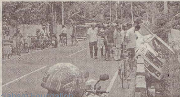
ததரிப்பு பகுதியில் திருமண வீட்டிற்குச் சென்ற கார்