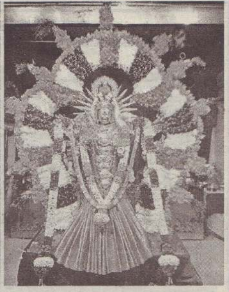
வரலாற்றுச் சிறப்பு மிக்க தெல்லிப்பழை ஸ்ரீ துர்க்காதேவி தேவஸ்தானத்தின் வருடாந்த மஹோற்சவத்தின் இரதோற்சவம் நேற்று சிறப்பாக இடம்பெற்றது.