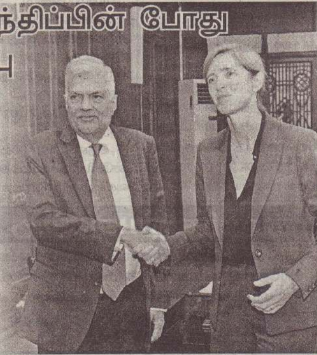
(04 ஆம் பக்கம் பார்க்க)

(கொழும்பு) இலங்கையின் பொருளாதார ஸ்திரத்தன்மைக்கு முழுமையான ஆதரவை வழங்க அமெரிக்கா அர்ப்பணிப்புடன் செயற்படும் என்று அமெரிக்காவின் சர்வதேச அபிவிருத்தி நிறுவனத்தின் நிர்வாகி சமந்தா பவர் தெரிவித்துள்ளார்.