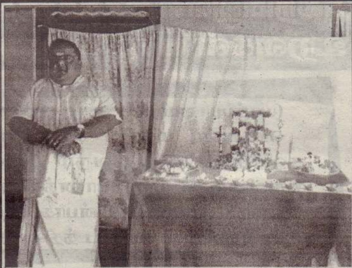
முன்னாள் யாழ்ப. மாநகர முதல்வர் அமரர் பொன். சிவபாலனின் 24 ஆவது நினைவு தினம் சித்தங்கேணியில் அவரது இல்லத்தில் உணர்வுபூர்வமாக நேற்று முன்தினம் அனுஷ்டிக்கப்பட்டது.

திகதி மு.ப 9 மணிக்கு சிவன் பண்ணை சீனிவாசகம் வீதி சந்தி, மு.ப 11 மணிக்கு கோணந்தோட்டம், பி.ப 2.30 மணிக்கு சோலைபுரம் ஆகிய இடங்களில் வைத்து தடுப்பூசி ஏற்றுவதற்கு தீர்மானிக்கப்பட்டுள்ளது. எனவே இச்சந்தர்ப்பத்தை பயன்படுத்தி தங்களது வளர்ப்பு நாய்களுக்கு தடுப்பூசியை பெற்றுக் கொள்ளுமாறும் ஒரு நாய்க்கான உரிமம் கட்டணமான 50 ரூபாய் அறவிடப்படும் எனவும் யாழ்ப. மாநகரசபை சுகாதார மருத்துவ அதிகாரி அறிவித்துள்ளார். (4)