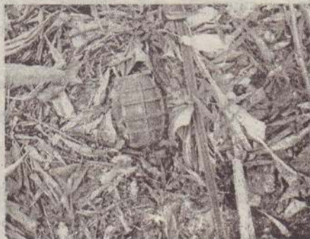
கான நடவடிக்கைகள் முன்னெடுக்கப்பட்டு வருகின்றன. (4-30)

(சாவகச்சேரி) கொடிகாமம் பொலிஸ் பிரிவிற் குட்பட்ட மந்துவில் கிழக்கு பகுதியில் உள்ள தனியார் காணி ஒன்றிலிருந்து நேற்று முன்தினம் ஞாயிற்றுக்கிழமை கைக்குண்டு ஒன்று அடையாளம் காணப்பட்டுள்ளது. காணி துப்புரவு பணியின் போது குறித்த கைக்குண்டு அவதானிக்கப்பட்ட நிலையில் கொடிகாமம் பொலிஸ் நிலையத்தில் முறைப்பாடு பதிவு செய்யப்பட்டு கைக் குண்டினை அப்புறப்படுத்துவதற்