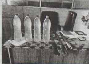
காலமாக கசிப்பு உற்பத்தியில் ஈடுபட்ட 38-வயதுடைய நபர் ஒருவர் கைது செய்யப்பட்டுள்ளதோடு அவரிடமிருந்து 50லீற்றர் கோடா, 8 லீற்றர் கசிப்பு, 3 வாள்களும்

தகவலின் படி, நேற்று யாழ்ப்பாண பொலிஸ் பிரிவுக்குட்பட்ட ஆறுகால் மடம் - ஆணைக்கோட்டை பகுதியில் நீண்ட