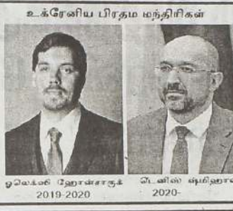
உக்கரையி பிரதம மந்திரிகள் ஓலெக்ஸி ஜோன்சாருக் 2019-2020 டெனிஸ் ஷ்மிஹால் 2020-

ஓலெக்ஸி வரேரியோவிச் ஜோன்சாருக் என்ற உக்கரையி அரசியல்வாதி 29 ஓகஸ்ட் 2019 முதல் 4 மார்ச் 2020 வரை உக்கரையின் பிரதமராக பணியாற்றினார். நியமனத்தின் போது 35 வயதில், உக்கரையி வரலாற்றில் அவர் மிகவும் இளைய பிரதமர் ஆவார். 2020 மார்ச் 4 இல் இருந்து டெனிஸ் அனடோலியோவிச் ஷ்மிஹால் உக்கரையின் பிரதமராக பணியாற்றி வருகிறார்.