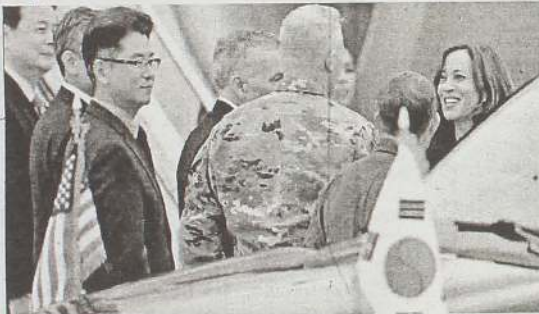
(சியோல்) வடகொரியாவின் கடும் எதிர்ப்புக்கு மத்தியில் அமெரிக்க துணை ஜனாதிபதி கமலா ஹாரிஸ் தென் கொரியா வந்தடைந்துள்ளார்.

இந்த விஜயத்தின் போது, கமலா ஹாரிஸ் எல்லை மற்றும் வடக்கு மற்றும் தெற்கைப் பிரிக்கும் அதிக வலுவூட்டப்பட்ட இராணுவமையமாக்கப்பட்ட மண் டலத்திற்கு பயணம் செய்வார் என அறிவிக்கப்பட்டுள்ளது. ஜப்பானில் உள்ள ஒரு இராணுவத் தளத்தில் அமெரிக்கத் துருப்புக்களிடம் உரையாற்றிய அவர் வடகொரியாவின் சமீபத்திய ஏவுதல்கள் மற்றும் அதன் பிராந்திய எந்திரத் தன்மைக்கு அச்சுறுத்தலான சட்டவிரோத ஆயுதத் திட்டம் ஆகியவற்றைக் கண்டித்தார்.