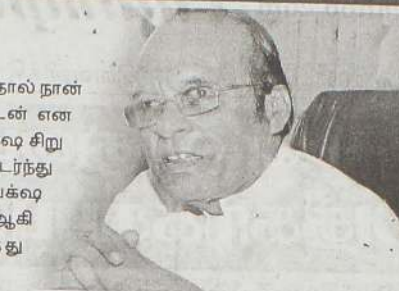
அறிவித்தமை முட்டாள்தனமான தீர்மானமாகும் என்றார். (ம-7)

நாடு வங்குரோத்து அடைந்து விட்டது. ஆகையால் எமக்கு அரசுமுறை கடன்களை மீள செலுத்த முடியாது என அரசாங்கம் உத்தியோகபூர்வமாக