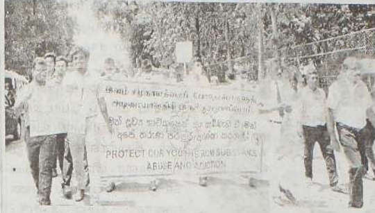
(யாழ்ப்பாணம்) போதைப்பொருள் பாவனைக்கு எதிராக விழிப்புணர்வுகளை ஏற்படுத்தும் நடவடிக்கையாக, யாழ்ப்பாணம் மருத்துவமனை தொழிற்சாலைகளின் கூட்டமைப்பின் ஏற்பாட்டில்

யாழ்ப்பாணத்தில் நேற்று பேரணி முன்னெடுக்கப்பட்டது.