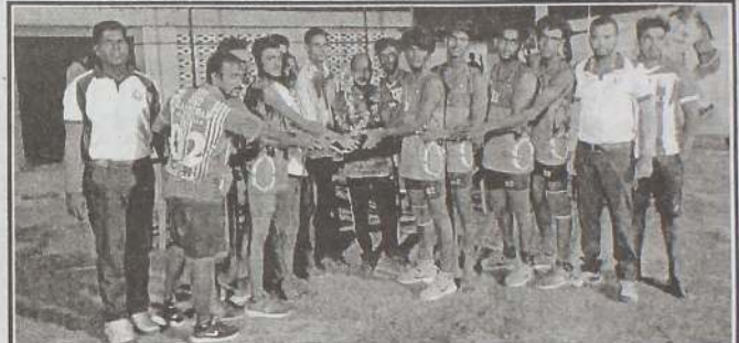
யாழ்.மாவுட்ட கரப்பந்தாட்ட சங்க 2022 ஆம் ஆண்டுக்கான B பிரிவு அணிகளுக்கான தீவக வலய போட்டிகள் நேற்று முன்தினம் சனிக்கிழமை காரைநகர் இளம் தென்றல் விளையாட்டுக் கழக மைதானத்தில் நடைபெற்றது. இப்போட்டியில் தீவகத்தின் 6 அணிகள் பங்குபற்றின.

இந்த நிலைமையை விரைவாக கட்டுப்படுத்தாவிட்டால், எதிர்வரும் சில வருடங்களுக்குள் இலங்கையில் இளம் பிரிவுகளில் அதிகமானவர்களின் சுகாதார நிலைமை மோசமடைந்து குடும்ப வாழ்க்கை சீரழிந்து, ஒழுக்கமற்ற சமூகவிரோத செயல்களுக்கு பெருமளவில் ஈடுபடும் சமூக சூழல் உருவாகும் அபாயம் இருக்கின்றது என தெரிவித்தார்.