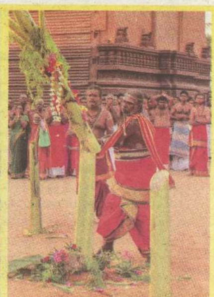
வரலாற்றுச் சிறப்புமிக்க நல்லூர்க் கந்தசுவாமி ஆலயத்தில் விஜயதசமி - மாண்பு உற்சவம் நேற்று இடம்பெற்றது. (யு-20)