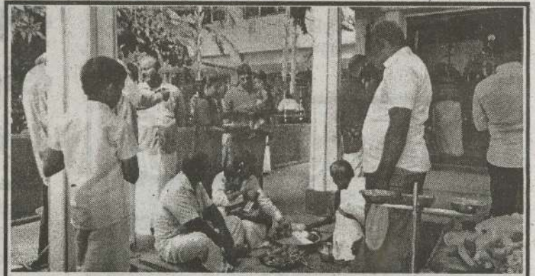
தெல்லிப்பழை மகாஜனக் கல்லூரியில் நேற்று விஜயதசமி விழா வழிபாடுகள். ஏடுதொடக்கல் மற்றும் பழைய மாணவர்களால் அன்பளிப்பு செய்யப்பட்ட திறன் வகுப்பறை திறப்பு விழா ஆகிய நிகழ்வுகள் இடம்பெற்றன. (புடம்-கணேசலிங்கம்)

இரணை இலுப்பை குளத்தைச் சேர்ந்த விவசாயிக்கு விவசாயத் திணைக்களம் வழங்கிய தாவல் நீர்ப்பாசன உபகரணத் தொகுதியின் உதவியுடன் விவசாய திணைக்களத்தின் நீர்ப்பாசனத் திட்டத்தின் கீழ் அவர்களின் ஆலோசனைக்கு அமைவாக உற்பத்தி செய்யப்பட்டிருந்தது. மேலும் வெங்காயம், பூசனிக்காய், கச்சான் கடலை, மிளகாய் உள்ளிட்டவையும் அறுவடை செய்யப்பட்டன. (4-285)