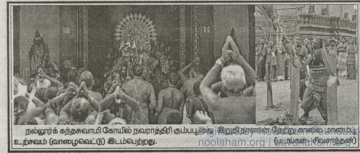
நல்லூர்க் கந்தசுவாமி கோயில் நவராத்திரி கும்பபூசை இறுதி நாளில் நேற்று காலை மாண்புமிகு உற்சவம் (வாழைவெட்டு) இடம்பெற்றது. (யாழ்ப்பாணம்)

ழமை இடம்பெற்ற நிகழ்வில் குறித்த தீயணைப்பு வாகனம் வழங்கி வைக்கப்பட்டது. குறித்த நிகழ்வில் நொதேன் தனியார் மருத்துவமனை நிர்வாகத்தினர், யாழ்ப்பாணம் மாநகர முதல்வர், யாழ்ப்பாணம் மாவட்ட செயலர், யாழ்ப்பாணம் மாநகர ஆணையாளர், யாழ்ப்பாணம் மாநகரசபை உறுப்பினர்கள் மற்றும் யாழ்ப்பாணம் வணிகர் கழக பிரதிநிதிகள், சி.பி.சி. அப்பப்படை பிரிவு உத்தியோகத்தினர் என பல்பேரும் கலந்து கொண்டனர். (4-33)