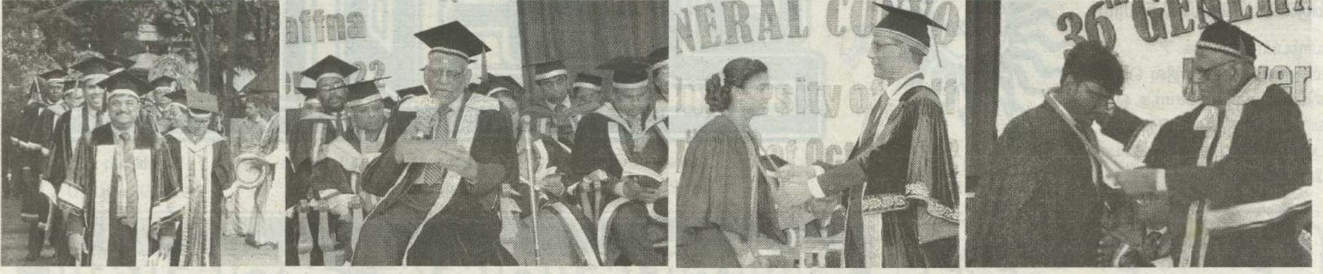
யாழ்ப்பாணப் பல்கலைக்கழகத்தின் 36 ஆவது பொதுப் பட்டமளிப்பு விழாவின் முதலாவது அமர்வு பல்கலைக்கழக வேந்தர் வாழ்நாள் பேராசிரியர் எஸ்.பத்மநாதன் தலைமையில் பல்கலைக்கழக உள்ளக விளையாட்டரங்கில் நேற்று ஆரம்பமாகியுள்ளது. எதிர்வரும் 8 ஆம் திகதிவரை 8 அமர்வுகளாக இடம்பெறவுள்ள இந்தப் பட்டமளிப்பு விழாவில் 2 ஆயிரத்து 378 பேர் பட்டங்களைப் பெறவுள்ளனர். (ச)