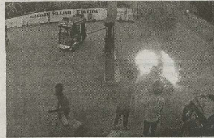
(நெளுக்குளம்) வவுனியாவில் எரிபொருள் நிரப்பு நிலையத்தில் எரிபொருள் எரினை நிரப்பும் போது மோட்

டார் சைக்கிள் ஒன்று தீப்பற்றி எரிந்த சம்பவம் ஒன்று பதிவாகியுள்ளது. குறித்த சம்பவமானது வவுனியா ஹொறவப் பொத்தான பகுதியில் அமைந்துள்ள எரிபொருள் நிரப்பு நிலையத்தில் கடந்த 4 ஆம் திகதி பதிவாகியுள்ளது.