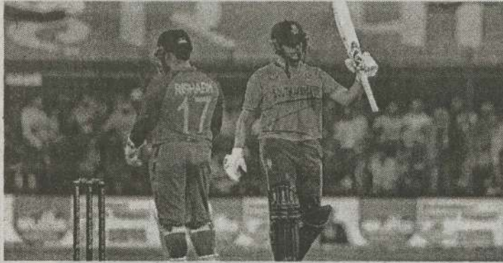
இந்திய அணிக்கெதிரான இருபது-20 போட்டியில் மூன்றாவதும் இறுதியுமான தென்னாபிரிக்க அணி 48

ஓட்டங்களினால் வெற்றி பெற்றுள்ளது. இந்தப் போட்டியின் நாணய சுழற்சியில் வெற்றி பெற்ற இந்திய அணிகளத் தடுப்பில் ஈடுபடத் தீர்மானித்தது.