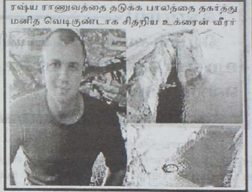
ரஷ்ய இராணுவத்தை தடுக்க பாலத்தை தகர்த்து மனித வெடிகுண்டாக சிதறிய உக்கரைன் வீரர்

புதுடில்லி உக்கரைன் நாட்டு ஜனாதிபதி ஜெனென்ஸ்கி, பிரதமர் நரேந்திர மோடியுடன் போர் சூழல் குறித்து பேசியுள்ளார். இதில் உ.நா. பாதுகாப்பு கவுன்சில் உக்கரைனுக்கு ஆதரவளிக்க வேண்டும் என்று உக்கரைன் ஜனாதிபதி கோரிக்கை வைத்த நிலையில், அவரிடம் இந்தியா இயன்றதை செய்யும் என்று பிரதமர் மோடி உறுதியளித்தார்.