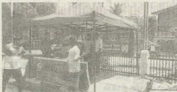
சர்வதேச அஞ்சல் திணைக்களம் முன்னிட்டு, யாழ்ப்பாணம் பிரதம தபாலகத்தினரால் நேற்றுமுன்தினம் பொதுமக்களுக்கு குளிர்பானம் வழங்கப்பட்டது.