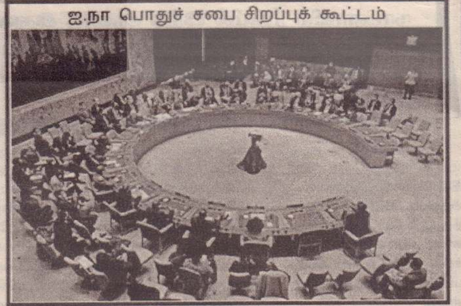
ஐ.நா பொதுச் சபை சிறப்புக் கூட்டம்

உலகளவில் அமெரிக்க ஆதிக்ககாலம் கடந்துவிட்டது. உக்கரைன் மீது தாக்குதல் நடப்பெற அமெரிக்கா தான் காரணம். இதிலிருந்து சிறிய நாடுகள் ஒன்றைத் தெரிந்து கொள்ளலாம். உங்களிடம் பலம் இல்லாவிட்டால் நீங்கள் வருந்த வேண்டி