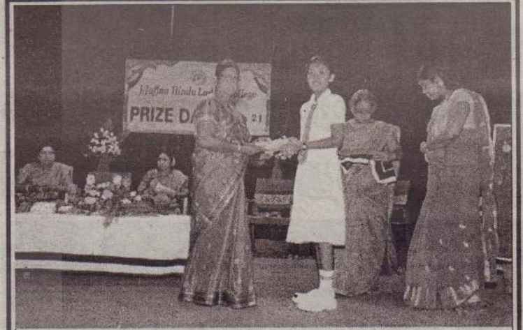
யாழ்.இந்து மகளிர் கல்லூரியின் பரிசில் நாள் நிகழ்வு 2020, 2021 கடந்த 8 ஆம் திகதி பாடசாலையின் விசாலாட்சி மண்டபத்தில் பாடசாலை அதிபர் தலைமையில் இடம்பெற்றது.

ஏலத்தில் பொருளினைக் கொள்வனவு செய்பவர் உடனடியாக கொடுப்பனவினை பணமாகச் செலுத்தி ஏலப்பொருளினை அப்புறப்படுத்த வேண்டும். கொடுப்பனவுகள் பணமாக மட்டும் ஏற்றுக் கொள்ளப்படும் என்பதுடன் காசோலைகள் ஏற்றுக் கொள்ளப்பட மாட்டாது என நீதிமன்ற பதிவாளர் அறிவித்துள்ளார். (4)