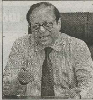
தற்கு முன்னர், அதாவது 2023 மார்ச் மாதத்திற்கு முன்னர் வழங்குவதற்கு திட்டமிட்டுள்ளதாகவும் அவர் தெரிவித்துள்ளார். (நி)

கடமை நிறைவேற்று அதிபர்களுக்கு அரசு சேவை ஆணைக்குழுவின் அனுமதியைப் பெற்று அதற்கான ஒழுங்குமுறையில் நியமனங்கள் வழங்க ஏற்பாடுகள் மேற்கொள்ளப்பட்டுள்ளன. இதன் மூலம் சுமார் 4000 பேருக்கு நியமனங்கள் வழங்க தயாராக உள்ளதாக அவர் தெரிவித்துள்ளார். இந்த நியமனங்களை அடுத்த கல்வி ஆண்டு ஆரம்பமாக