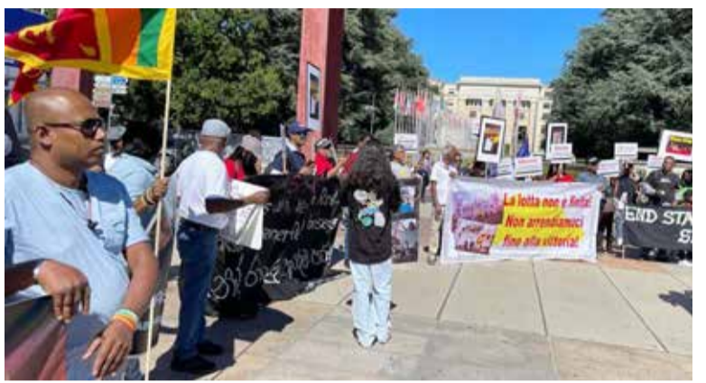
வைக்கப்பட்டுள்ள போராட்டக்காரர்களை விடுவிக்குமாறு கோரி ஜெனிவாவில் போராட்டத்தில் ஈடுபட்டவர்கள் கோரிக்கை விடுத்துள்ளனர். (அ)