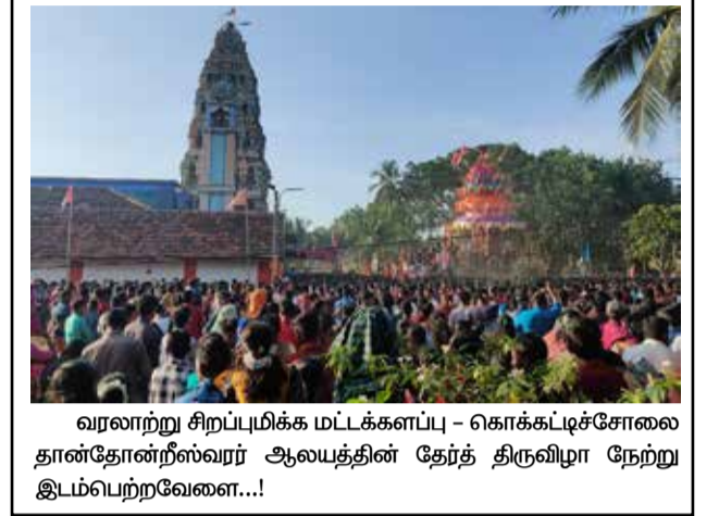
வரலாற்று சிறப்புமிக்க மட்டக்களப்பு - கொக்கட்டிச்சோலை தான்தோன்றிஸ்வரர் ஆலயத்தின் தேர்த் திருவிழா நேற்று இடம்பெற்றவேளை...!