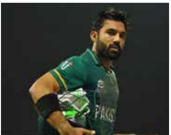
பொய், செப். 13

15ஆவது ஆசிய கிண்ணத்தை இலங்கை அணி கைப்பற்றியது. நேற்று முன்தினம் நடந்த இறுதிப் போட்டியில் பாகிஸ்தான் அணியை 23 ஓட்டங்கள் வித்தியாசத்தில் இலங்கை அணி வெற்றி பெற்றது. அத்துடன் 6ஆவது முறையாக ஆசியக் கிண்ணத்தை கைப்பற்றி அசத்தியது. இந்த ஆட்டத்தில் ஒரு கட்டத்தில் பாகிஸ்தான் அணி எளிதாக வெற்றி பெறும் என்று