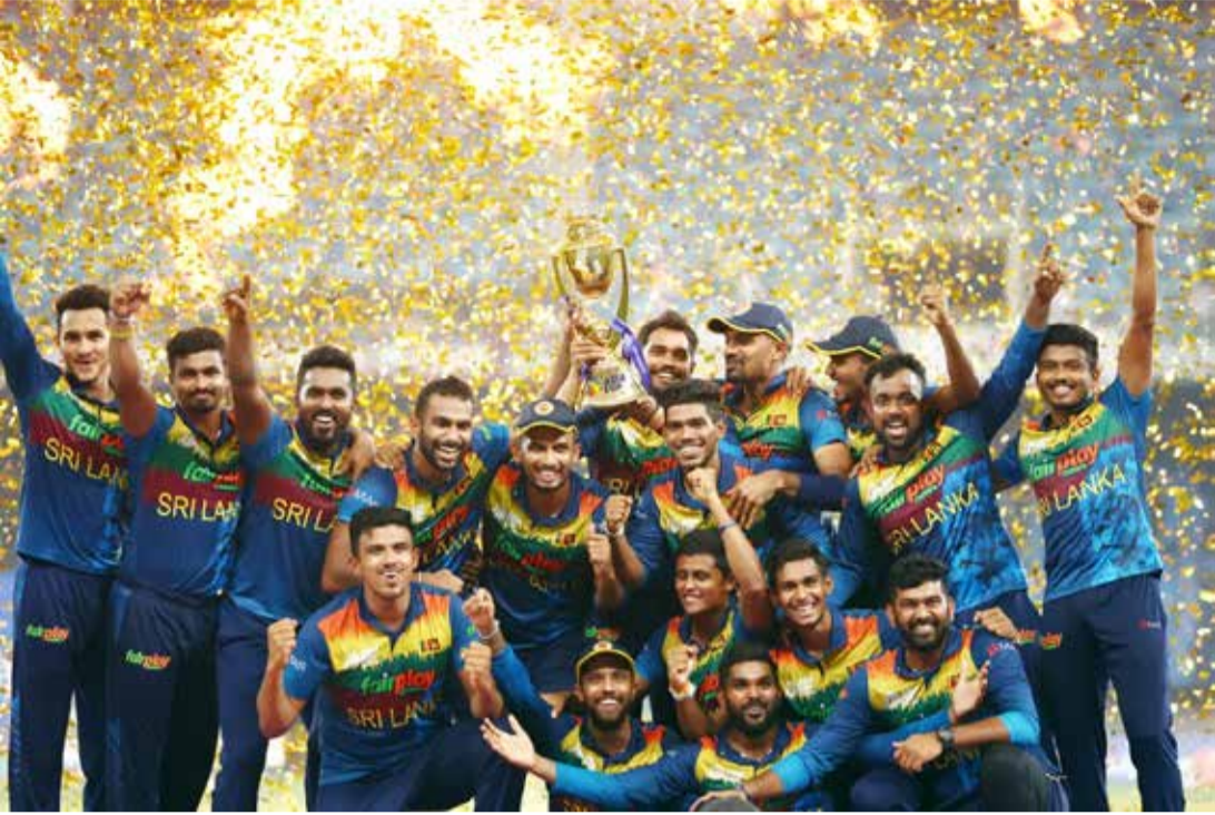
ஆசியக் கிண்ணத்தை ஆறாவது தடவையாக வெற்றி கொண்ட மகிழ்ச்சியில் இலங்கை அணி.