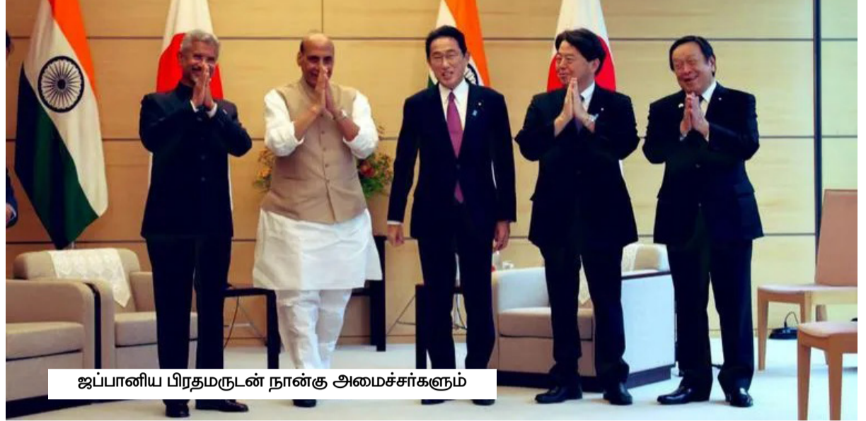
ஜப்பானிய பிரதமருடன் நான்கு அமைச்சர்களும்

பாதுகாப்பு உபகரணங்களிலும் நாடுகள் ஒத்துழைக்கும். ஆளில்லா தரை வாகனங்கள் மற்றும் ரோபாட்டிக்ஸ் ஆகியவற்றின் கூட்டு வளர்ச்சிக்கு கூடுதலாக, ஜப்பானும் இந்தியாவும் பாதுகாப்பு உபகரணங்