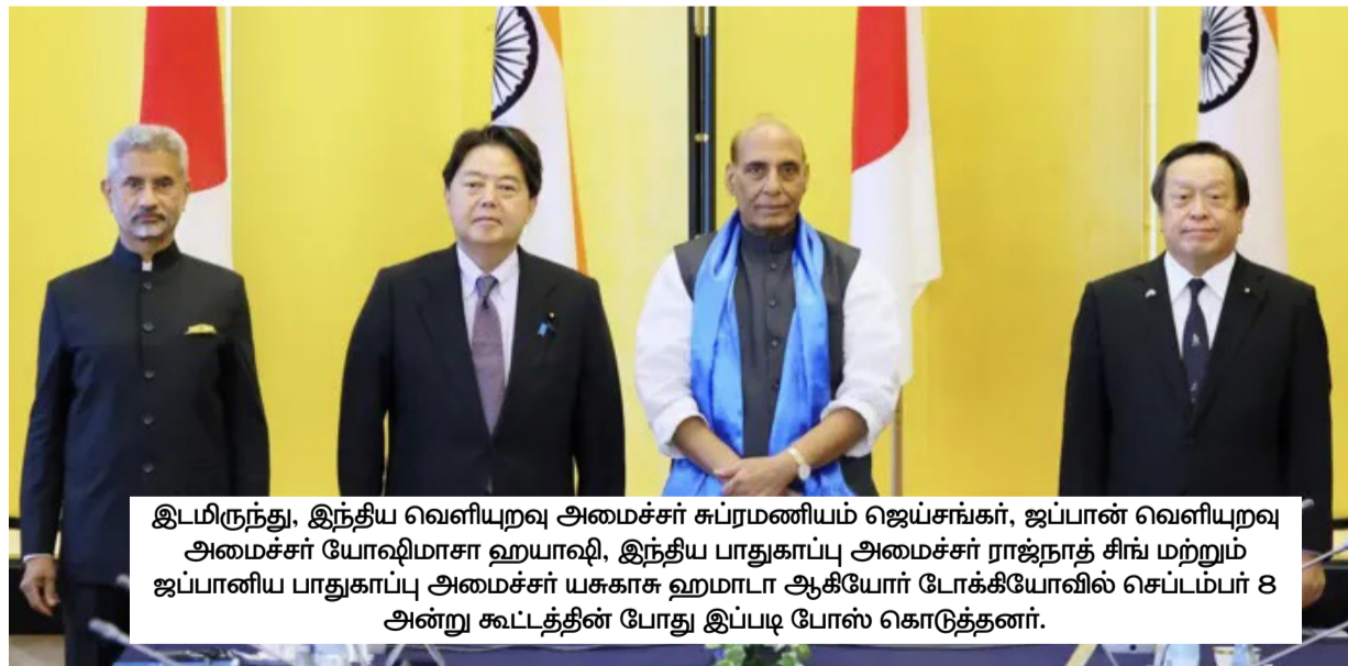
இடமிருந்து, இந்திய வெளியுறவு அமைச்சர் சுப்ரமணியம் ஜெய்சங்கர், ஜப்பான் வெளியுறவு அமைச்சர் யோஷிமாசா ஹயாஷி, இந்திய பாதுகாப்பு அமைச்சர் ராஜ்நாத் சிங் மற்றும் ஜப்பானிய பாதுகாப்பு அமைச்சர் யசுகாசு ஹமாடா ஆகியோர் டோக்கியோவில் செப்டம்பர் 8 அன்று கூட்டத்தின் போது இப்படி போஸ் கொடுத்தனர்.

உக்ரைன் தொடர்பாக இந்தியாவைக் கொண்டு வருவது கடினமாக இருக்கலாம், ஆனால் சீன விவகாரத்தில் ஜப்பானும் இந்தியாவும் இணைந்து செயல்பட நிறைய இடங்கள் உள்ளன. - என்றார் அவர்.