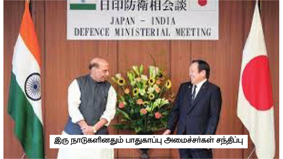
இரு நாடுகளினதும் பாதுகாப்பு அமைச்சர்கள் சந்திப்பு

இருப்பினும் ஹொக்கைடோவின் வடகிழக்கில் உள்ள தீவுகளை ஜப்பான் உரிமை கோரும் பின்னணியில், ரஷ்ய கூட்டுப்பாட்டில் உள்ள - வடக்குப் பிரதேசங்கள் என்று அழைக்கப்படும் - ரஷ்ய கூட்டுப்பாட்டில்