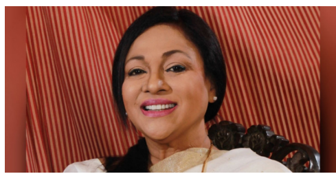
எதாகவும் கூறினார். மேலும் குறித்த சேவை 24 மணி நேரமும் இயங்கும் எனவும் இராஜாங்க அமைச்சர் கீதா குமாரசிங்க தெரிவித்தார்.

குடும்ப வன்முறையால் பாதிக்கப்படும் பெண்களுக்கான திட்டம் ஆரம்பிக்கப் படவுள்ளதாக சிறுவர் மற்றும் மகளிர் விவகார இராஜாங்க அமைச்சர் கீதா குமாரசிங்க தெரிவித்தார். மேலும் மாவட்ட அளவில் பெண்களுக்கான நிலையங்கள் அமைக்கப்படும் என்றும் இராஜாங்க அமைச்சர் கீதா குமாரசிங்க தெரிவித்தார். குடும்ப வன்முறை தொடர்பான முறைப் பாடுகளை சமர்ப்பிப்பதற்கு 1938 என்ற தொலைபேசி சேவை ஆரம்பிக்கப்பட்டுள்