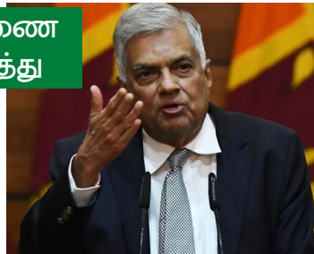
ரீதியில் மிகவும் அவதானமாக இருங்கள். - இவ்வாறு ஜனாதிபதி ரணில் விக்கிரமசிங்க, இலண்டன் செல்வதற்கு முன்னர்

ஜெனிவாச் சவாலை நாம் இலகுவாக முறியடித்தே தீருவோம். புதிய பிரேரணை தொடர்பில் நாம் அலட்டிக்கொள்ளாத தேவையில்லை. இலங்கை அரசை மீறி நாட்டுக்கு எதிராக எதுவும் நடைபெற சந்தர்ப்பம் இல்லை. இந்நிலையில், அவ்விவகாரம் தொடர்பில் ஊடகங்களிடம் கருத்துக்களை வெளியிடும்போது அரசு என்ற