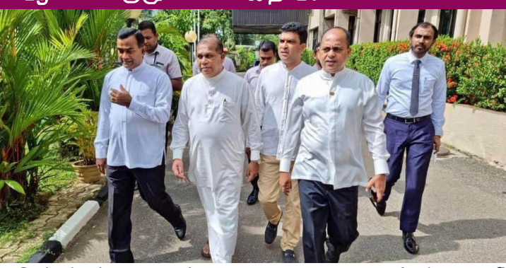
தேர்தல்கள் ஆணைக் குழுவின் மேலதிக தேர்தல்கள் ஆணையாளரை (உள்ளூராட்சி) இன்று சந்தித்த ஐக்கிய