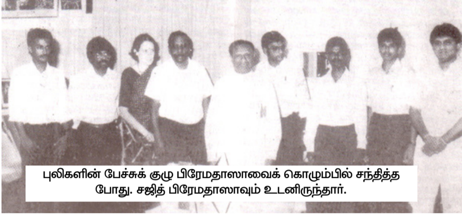
புலிகளின் பேச்சுக் குழு பிரேமதாஸாவைக் கொழும்பில் சந்தித்த போது. சஜித் பிரேமதாஸாவும் உடனிருந்தார்.

தமிழர்கள் தங்களுடன் இருந்த புத்தி ஜீவிகளின் ஆற்றல்களாலும், அரசியல் அனுபவங்கள் கொண்டிருந்த தலைவர்கள், அவர்கள் கடைப்பிடித்திருக்கக்கூடிய அணுகுமுறைகள், சாதாரியங்கள் போன்றவற்றாலும் தமிழரது இனப்பிரச்சினைக்கான தீர்வைப் பெற வேறு வழிகளில் முன்னேறி இருக்கலாம்.