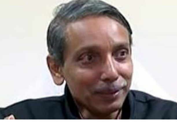
குறைந்தபட்சம் 48 இந்தியப் பல்கலைக்கழகங்கள் வெளிநாட்டு உயர்கல்வி நிறுவனங்களுடன் கல்விசார் ஒத்துழைப்பைத் தொடங்கியுள்ளன அல்லது ஒப்பந்தங்