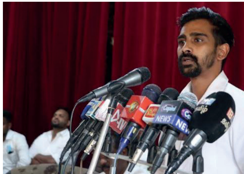
ஆயிரம் ரூபாவை ஓரணியில் நின்று கேட்க வலியுறுத்தினோம். அச்சத்தால் தொழிலாளர்கள் பிளவுபட்டு நின்றனர். துரமாரை கண்டு அஞ்ச வேண்டியதில்லை. கட்சி, தொழிற்சங்க பேதங்களும் அவசியமில்லை என்றார். மலையகத்துக்கு திடீரென வரும் சில அரசியல்வாதிகள், தொழிற்சங்கங்களை விமர்சிப்பார்கள், ஆனால் கம்பனிகளை விமர்சிப்பதில்லை. அப்படியானவர்கள் கூறும் கருத்தை எம்மவர்களில் சிலர் நம்புவதும் உண்டு. இந்நிலைமையும் மாற வேண்டும் என்றார்.

இருக்கின்றோம். எதற்காக தற்போது தொழிற்சங்க நடவடிக்கை முன்னெடுக்கப்படுகின்றது என நீங்கள் கேட்கலாம். ஆயிரம் ரூபாய் தொடர்பான வழக்கு விசாரணை நீதிமன்றத்தில் நிலுவையில் இருந்தது. அதனால்தான் நாம் நடவடிக்கையில் இறங்கவில்லை. நீதிமன்றத்தின் தீர்ப்பு வெளிவந்துள்ளது. தொழிற்சங்கங்களுக்கு வெற்றி கிடைத்துள்ளது. எமது கோரிக்கை நியாயமானது. அதனால்தான் போராடுகின்றோம். சம்பள நிர்ணய சபைக்கு நாளை நாம் சென்றால்கூட எமக்குதான் சாதகமாக அமையும். தோட்டத் தொழிலாளர்கள் மற்றும் தொழிற்சங்கங்களுக்கு இடையில் ஒற்றுமை இருக்க வேண்டும். அவ்வாறு ஒற்றுமை இருப்பது எமக்கு பலம். எனினும், அந்த ஒற்றுமை எம்மிடையே முழுமையாக இல்லை. அது எமது பலவீனமாகும். எமது இந்த பலவீனம் நிர்வாகத்துக்கு சாதகமாக அமைந்துவிடுகின்றது. எமது ஒற்றுமையை கண்டு தோட்ட நிர்வாகங்கள் நடுங்க வேண்டும்.