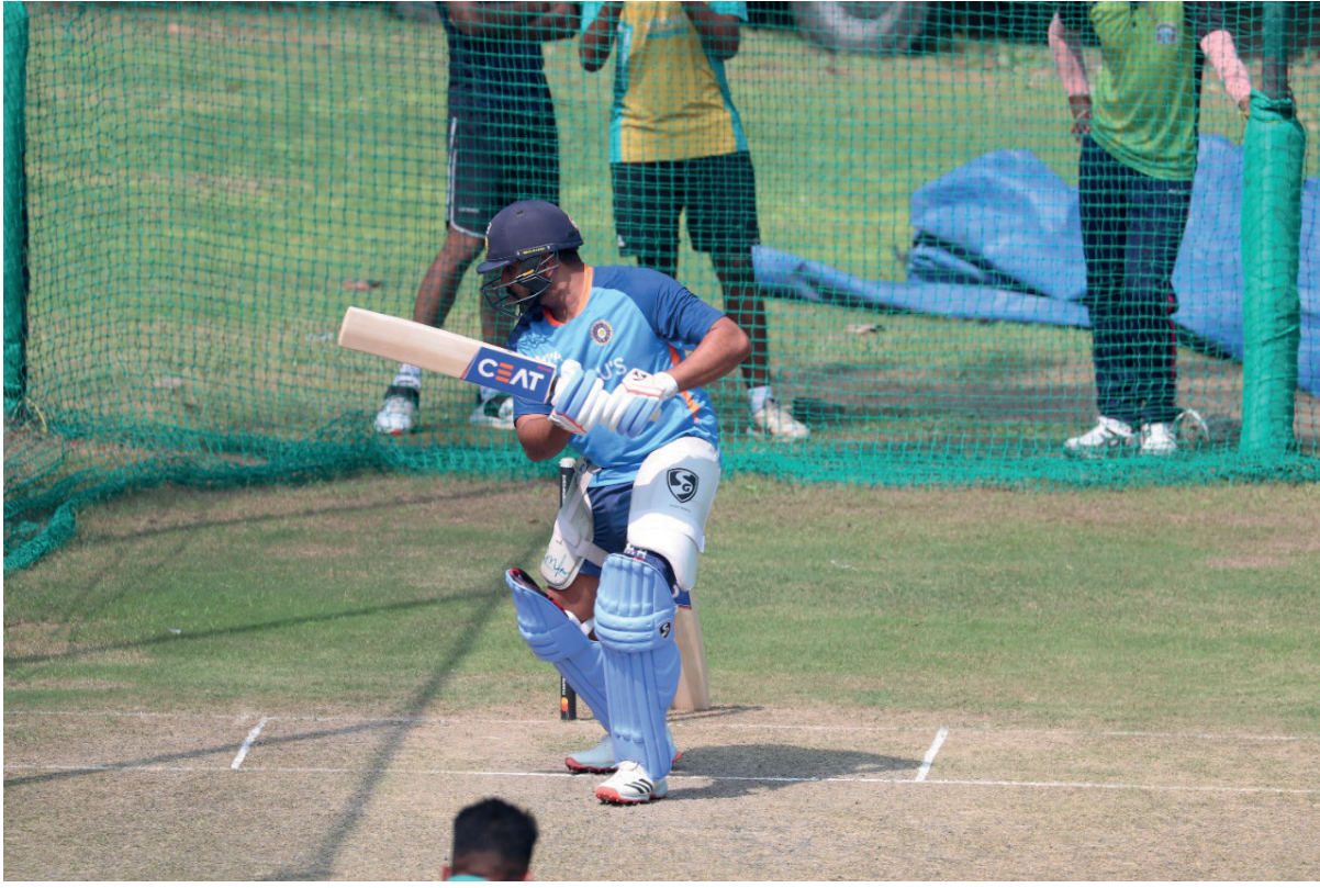
இன்று ஆரம்பிக்கிறது இ-20 தொடர்: