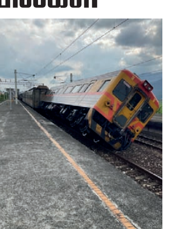
அதே சமயம் சில்ஹெங் மற்றும் யாலி நகரங்களுக்கு இடையில் உள்ள பூலி என்கிற நகரில் சென்று கொண்டிருந்த பயணிகள் ரயில் ஒன்று தடம் புரண்டு விபத்துக்குள்ளானதாகத் தெரிவிக்கப்பட்டுள்ளது. எனினும் பயணிகள் அனைவரும் பத்திரமாக மீட்கப்பட்டதாகவும் தகவல்கள் தெரிவிக்கின்றன.

இந்நிலநடுக்கமானது ரிசுட்ர் அளவுகோலில் 6.8 ஆகப் பதிவானதாக அமெரிக்க புவிவியல் ஆய்வு மையம் தெரிவித்துள்ளது. இதன் காரணமாக தலைநகர் தைபே உட்பட நாட்டின் பல நகரங்களிலும் இந்த நிலநடுக்கம் உணரப்பட்டதாகத் தெரிவிக்கப்பட்டுள்ளது. குறிப்பாக அடுக்குமாடி குடியிருப்புகள், வணிக வளாகங்கள் உள்ளிட்ட கட்டிடங்கள் குறுங்கியதாகவும், இதனால் பீதியடைந்த மக்கள் அலறியடித்தப்படி கட்டிடங்களை விட்டு வெளியேறி வீதிகளிலும், திறந்தவெளி மைதானங்களிலும் தஞ்சம் புகுந்தனர் எனவும் தெரிவிக்கப்பட்டுள்ளது.