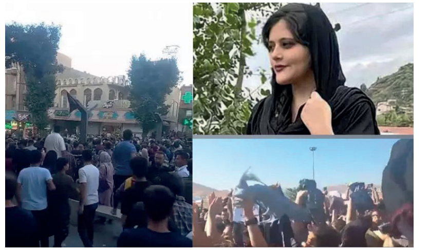
மேலும், ஈரான் ஜனாதிபதி இப்ராகிம் ரைசிக்கு எதிராக ஆர்பாட்டத்தில் ஈடுபட்ட பெண்கள் 'சர்வாதிகாரிக்கு மரணம்' என்ற கோஷத்தையும் எழுப்பினர். பல பகுதிகளில் போராட்டக்காரர்கள் மீது பொலிஸார் தடியடி நடத்தியதாகவும் தெரிவிக்கப்பட்டுள்ளது.

இச்சம்பவமானது உலகளவில் பெரும் அதிர்வலைகளை ஏற்படுத்தியிருந்ததோடு இதற்கு எதிர்ப்பு தெரிவித்து ஆயிரக்கணக்காக பெண்கள் போராட்டங்களில் ஈடுபட்டு வருகின்றனர். குறிப்பாக அப்பெண்ணின் சொந்த ஊரான சூழில் நகரில் நேற்று முன்தினம் திரண்ட நூற்றுக்கணக்கான பெண்கள் தங்கள் அணிந்திருந்த ஹரிஜாப்பை கழற்றி எறிந்து போராட்டத்தில் ஈடுபட்டனர்.