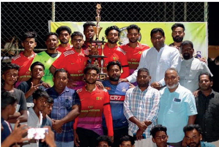
புத்தளம் வெட்டாளை அசன் குத்துஸ் வித்தியாலயத்தின் பொன்விழா:

வேண்டியுள்ளதுடன், ரிஷப் பண்டிடமிருந்தும் மிகவும் மேம்பட்ட பெறுபேறுகள் எதிர்பார்க்கப்படுகிறது. மறுபக்கமாக அவுஸ்திரேலிய அணியில் தன்னை இடம்பெறச் செய்து கொள்வதற்கான மிகச் சிறந்த வாய்ப்பாக டிம் டேவிட்டுக்கு இத்தொடர் காணப்படுகின்றது. தவிர, ஸ்டீவ் ஸ்மித்தும் தனதிடத்தை அணியில் நிரூபிக்க வேண்டிய கட்டாயத்திலுள்ளார்.