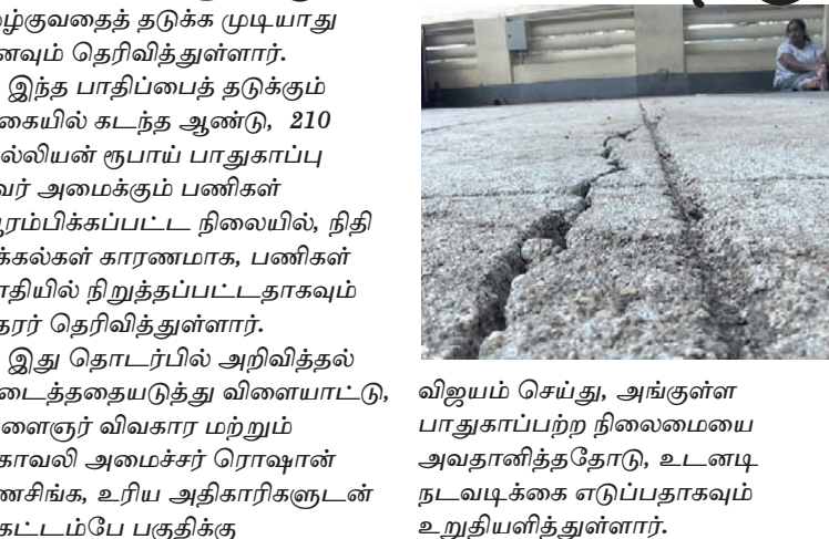
மூழ்குவதைத் தடுக்க முடியாது எனவும் தெரிவித்துள்ளார். இந்த பாதிப்பைத் தடுக்கும் வகையில் கடந்த ஆண்டு, 210 மில்லியன் ரூபாய் பாதுகாப்புக் கவர் அமைக்கும் பணிகள் ஆரம்பிக்கப்பட்ட நிலையில், நிதி சிக்கல்கள் காரணமாக, பணிகள் பாதியில் நிறுத்தப்பட்டதாகவும் தேரர் தெரிவித்துள்ளார். இது தொடர்பில் அறிவித்தல் கிடைத்ததைடுத்து விளையாட்டு, இளைஞர் விவகார மற்றும் மகாவலி அமைச்சர் ரொஷான் ரணசிங்க, உரிய அதிகாரிகளுடன் கெட்டம்பே பகுதிக்கு