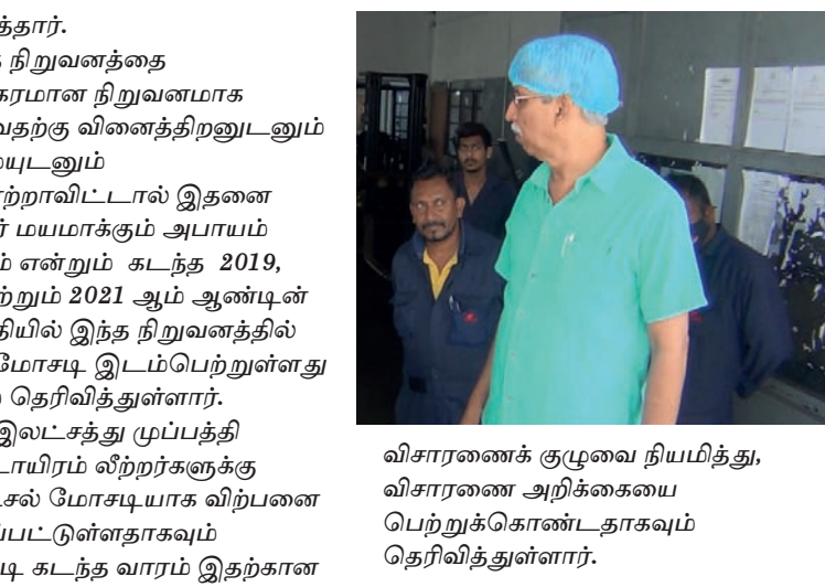
விசாரணைக் குழுவை நியமித்து, விசாரணை அறிக்கையை பெற்றுக்கொண்டதாகவும் தெரிவித்துள்ளார்.

தெரிவித்தார். இந்த நிறுவனத்தை இலாபகரமான நிறுவனமாக மாற்றுவதற்கு வினைத்திறனுடனும் நேரமையுடனும் பணியாற்றாவிட்டால் இதனை தனியார் மயமாக்கும் அபாயம் ஏற்படும் என்றும் கடந்த 2019, 2020 மற்றும் 2021 ஆம் ஆண்டின் பிற்பகுதியில் இந்த நிறுவனத்தில் பாரிய மோசடி இடம்பெற்றுள்ளது என்றும் தெரிவித்துள்ளார். ஒரு இலட்சத்து முப்பத்தி இரண்டாயிரம் லீற்றர்களுக்கு மேல் டீசல் மோசடியாக விற்பனை செய்யப்பட்டுள்ளதாகவும் அதன்படி கடந்த வாரம் இதற்கான