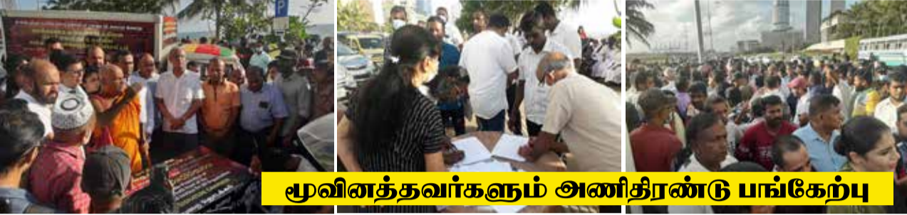
முவினத்தவர்களும் அணிதிரண்டு பங்கேற்பு

பயங்கரவாதத் தடைச் சட்டத்துக்கு எதிராகக் கையெழுத்துத் திரட்டும் போராட்டம் நேற்று கொழும்பு - காலிமுகத்திடலில் முன்னெடுக்கப்பட்டது. தமிழ்த் தேசியக் கூட்டமைப்பின் பேச்சாளர் ஜனாதிபதி சட்டத்தரணி எம்.ஏ. சமந்திரன் உள்ளிட்ட எதிரணி நாடாளுமன்ற உறுப்பினர்கள், இலங்கை ஆசிரியர் சங்கத்தின் பொதுச்செயலாளர் ஜோசப் ஸ்டாலின் உள்ளிட்ட தொழிற்சங்கங்கள் மற்றும் வெகுஜன அமைப்புக்களின் பிரதிநிதிகள், முன்னாள் நாடாளுமன்ற உறுப்பினர்கள், மதகுருமார்கள்