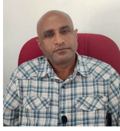
பாதிக்கப்படுகின்றார்கள். யூரியா வழங்குவதில் பாரபட்சம் காட்டாமல் மலையக மரக்கறி உற்பத்தியாளர்களுக்கும் 10 ஆயிரம் ரூபாவுக்கு யூரியா வழங்க வேண்டும்.