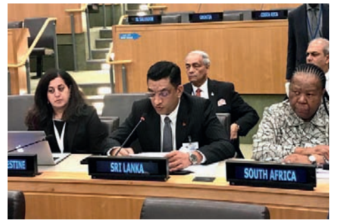
உயர் மட்ட கூட்டத்தில் உரையாற்றும் போதே வெளிவிவகார அமைச்சர் இதனை தெரிவித்துள்ளார். அவர் மேலும் கூறுகையில், தொடர்ச்சி P2

இலங்கையில் அனைத்து சமூகங்களினதும் உரிமைகள் மற்றும் சுதந்திரத்தை பாதுகாக்கவும், அதற்கான சமூக கட்டமைப்பை உருவாக்கவும், நல்லிணக்கத்தை கட்டியெழுப்புவதற்கான முயற்சிகளில் அரசாங்கம் ஈடுபட்டு வருவதாக வெளிவிவகார அமைச்சர் அலி சப்ரி தெரிவித்துள்ளார்.