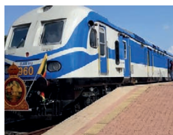
பந்துல குணவர்தன தெரிவித்தார். தொடர்ச்சி P2

இந்தியாவின் நிதி உதவித்திட்டத்தின் கீழ் வடக்குக்கான ரயில் பாதை ஆரம்பப்பு பணிகள் அடுத்த ஆண்டு ஜனவரி மாதம் ஆரம்பிக்கப்படவுள்ளதால் ஐந்து மாதங்களுக்கு வடக்குக்கான ரயில் சேவைகள் நிறுத்தப்படவுள்ளதாக போக்குவரத்து மற்றும் ஊடகத்துறை அமைச்சர்