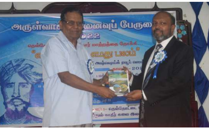
தெல்தோட்டை ஊடக மன்றமும், அருள்வாக்கி அப்துல் காதிர் கலை இலக்கியக் கழகமும் இணைந்து ஏற்பாடு