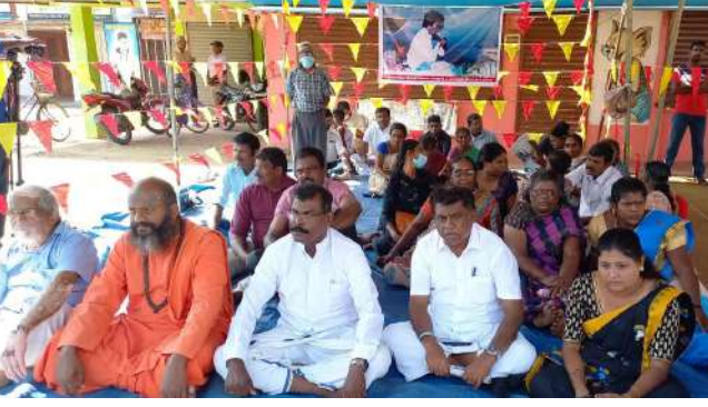
யாழ்ப்பாணம் - நல்லூர் பகுதியில் அமைந்துள்ள தியாகி திலீபனின் நினைவிடத்தில், நினைவேந்தல்

பொதுக்கட்டமைப்பின் ஏற்பாட்டில் அடையாள உண்ணாவிரதம் இன்று காலை 8 மணிக்கு ஆரம்பமாகியுள்ளது. இந்த அடையாள உண்ணாவிரதம் இன்று மாலை 5 மணி வரை நடைபெறவுள்ளது. தியாகி திலீபனின் நினைவேந்தல் தமிழர் தாயகம் உள்ளிட்ட