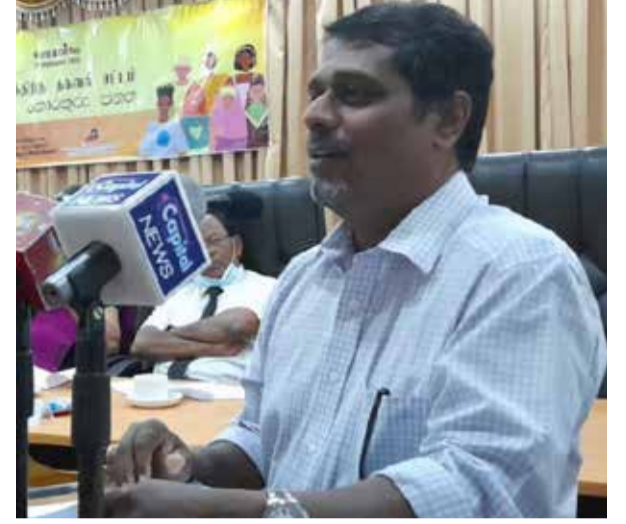
பாடசாலை மட்டத்தில் இந்தச் சட்டம் தொடர்பில் விழிப்புணர்வை ஏற்படுத்த வேண்டும். அரசு அலுவலகம் தாமாகவே முன்வந்து தகவல்களை விரைவில் வழங்கக் கூடிய வகையில் நடைமுறைகள் கொண்டு வரப்பட வேண்டும். - என்றார்.

மேன் முறையீடுகள், வடக்கில் மேற்கொள்ளப்பட வேண்டும். தகவல் அறியும் உரிமைச் சட்டம் தொடர்பான அதிகாரங்கள் மாகாணத்துக்கு வழங்க வேண்டும். தகவலை இலகுவாக பெற்றுக்கொள்ளக் கூடிய பொறி முறை உருவாக்கப்பட வேண்டும்.