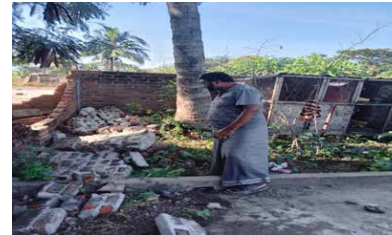
சம்மாந்துறை நிருமர் ஈ.எல்.எம் நாளிம்

அம்பாறை மாவட்டம், சம்மாந்துறை பிரதேசத்தில் நாளாந்தம் காட்டு யானைகளின் தொல்லைகள்காணப்படுகின்றன. இதனால், பொது மக்கள் பெரிதும் அச்சமடைந்துள்ளார்கள். இன்று(29)அதிகாலையும் சம்மாந்துறை நெற்பட்டிச் சந்திக்கு அருகாமையில் உள்ள அரிசி ஆலைகளைகாட்டு யானை ஒன்று சேதப்படுத்தியுள்ளது. மூன்று அரிசி ஆலைகளில் உள்ள மதில்