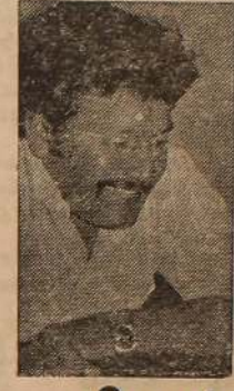
சைக்கிளில் சென்றவர் மீது சிப்பாய் குட்டு